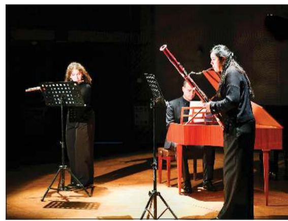
جانف من الحفل

واختتمت الأمسية بعمل المؤلف الفرانسي فرانسيس بولانك من القرن العشرين، اتسم بتنوعه الهارموني وتبدلاته المفاغحة بين الطابع الغنائي والإيقاعي، مستفيداً من الإمكانيات التقنية المتقدمة للألات النغمية.