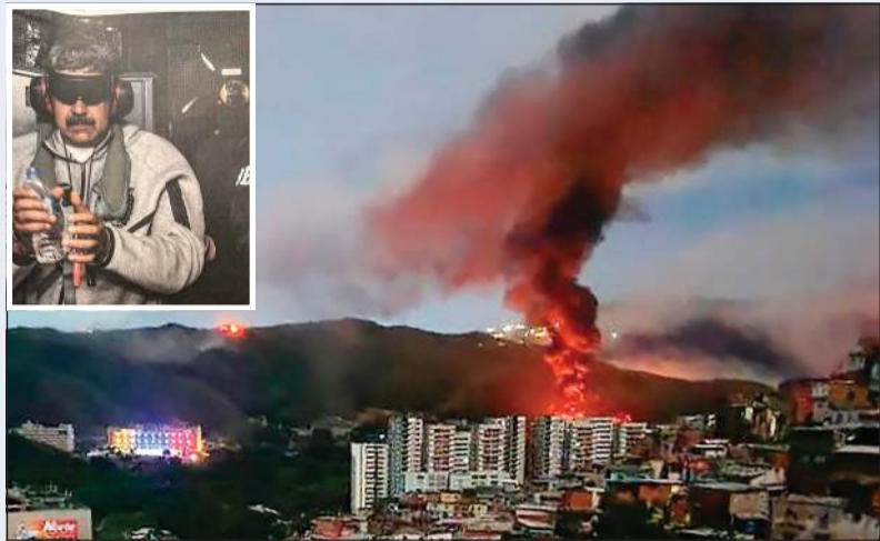
النيرون تشتعل نتيجة القصف على كاراكاس وفي الإطار الرئيس نيكولاس مادورو أثناء اعتقاله

أسباب تتعلق بالصالح العام وقضايا تعاطي المخدرات ومخالفة القوانين واللوائح المعمول بها