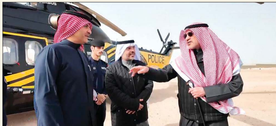
القائد الأول لرئيس مجلس الوزراء ووزير الداخلية الشيخ فهد اليوسف خلال جولة ميدانية في البدلي وبيدو وكيل وزارة الشؤون الاجتماعية د.خالد العجمي