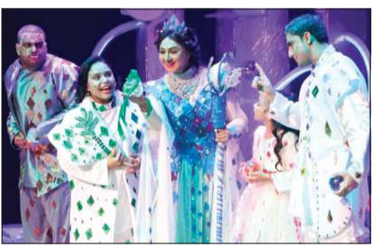
هيفاء حسين في مشهد من مسرحية «ملكة إيليرا»