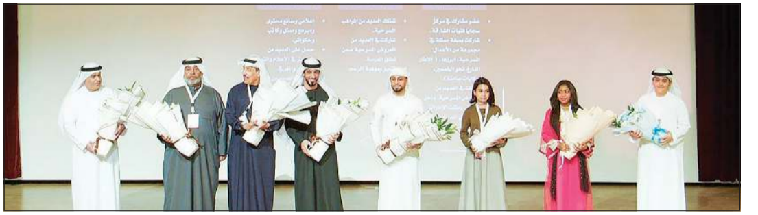
لجنة تحكيم المهرجان للكبار والأطفال في لقطة جماعية