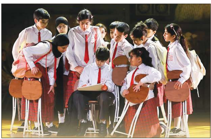
مشهد من مسرحية «الإطار الفارغ» لفرقة منتسبي ربيع قرن للمسرح

المهرجان تم تكريم الفنان عبدالله راشد التي حملت هذه الدورة اسمه وذلك تقديراً لجهوده الطويلة والمستدامة في مسرح الطفل، وقد تكونت لجنة تحكيم المهرجان للكبار من وليد الزعابي رئيساً، وعضوية كل من إبراهيم سالم، محمد سعيد السلطي، عبدالرحمن الملا، ومحمد جمعة علي، بينما تكونت لجنة تحكيم الأطفال من نور حمد عبدالرزاق، شيخة سيف عزيز، وعيسى عبدالله المازني.