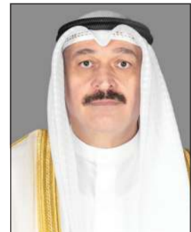
د. أحمد العوضي

دشن وزير الصحة د. أحمد العوضي خدمة تراخيص الأشعة الرقمية في إدارة الوقاية من الإشعاع التابعة لقطاع الصحة العامة، والتي تتيح للممارسين الصحيين تقديم طلبات إصدار وتجديد تراخيص الأشعة إلكترونياً بالكامل، دون الحاجة للمراجعة الحضورية، بما يعزّز سرعة الإنجاز، ويرفع جودة الخدمة، ويحسن تجربة المستفيدين، ضمن مسار التحول الرقمي الذي تتبناه الوزارة. وجاء التشدين خلال زيارة