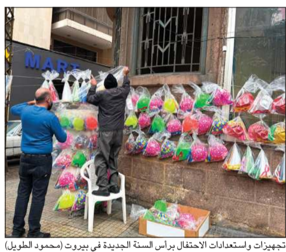
تجهيزات واستعدادات الاحتفال برأس السنة الجديدة في بيروت

جوزف عون ومعه رئيسا مجلس النواب والحكومة نبيه بري ونواف سلام على وجوب قيام إسرائيل بخطة معينة قبل البدء بالحديث عن المرحلة الثانية شمال الليطاني، مع تأكيدهم على أن لبنان ملتزم بهذه المرحلة، لكن طالما الجانب الإسرائيلي لم يقدم أي شيء، فإن هذا الأمر سيقابل بعدم تسهيل من قبل «حزب الله». من هنا الإحاح على راعي اتفاق وقف الأعمال العدائية سواء الولايات المتحدة أو فرنسا كي يطالبا إسرائيل بتنفيذ بعض الخطوات كالانسحاب من بعض التلال أو تسليم عدد من الأسرى من أجل الطلب من «حزب الله» تنفيذ المرحلة الثانية من الخطة. في حال، يفترض أن يصدر عن لجنة «الميكانيزم» بيان مشترك عن الجهات