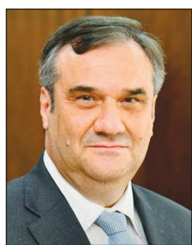
عبد القادر الحصري

وكالات: أكد حاكم مصرف سورية المركزي عبد القادر الحصري أن الليرة الجديدة التي أعلن أنه سيتم بدء التداول بها مطلع العام، ليست مجرد وسيلة تبادل، بل رمز لنجاح الثورة السورية، والانتماء، والثقة بالقدرة على النهوض». وقال الحصري في منشور عبر صفحته على فيسبوك: «مع إطلاق العملة الجديدة، لا نحفل بورقة نقدية فحسب، بل نحفل بسيادتنا وهويتنا الوطنية». موضحا أن هناك تآزر دولية كثيرة تؤكد أن العملة الوطنية تصبغ قوية عندما يلتف الناس حولها.