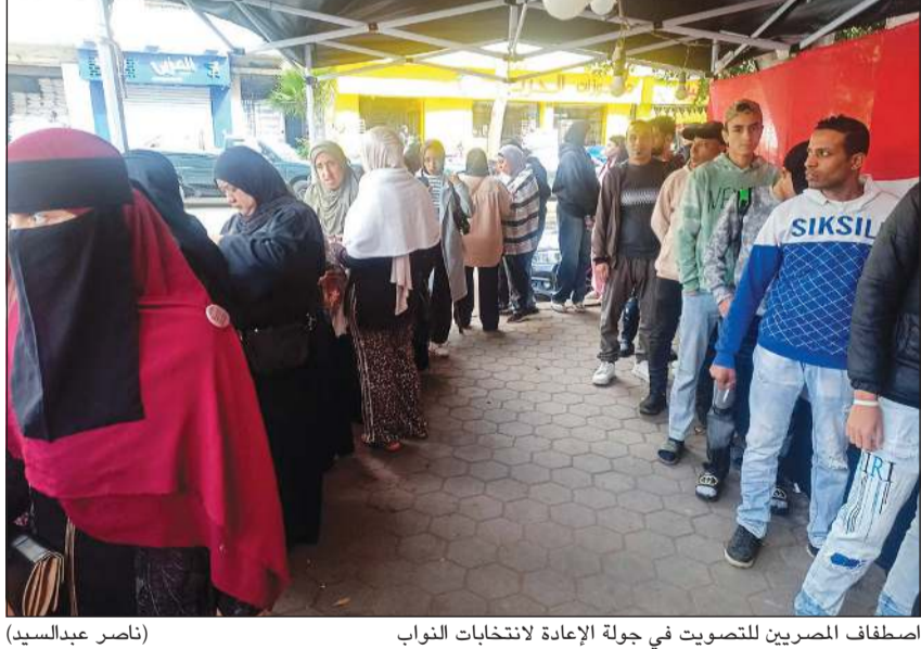
اصطفاف المصريين للتصويت في جولة الإعادة للانتخابات النيابية (ناصر عبدالسيد)

القاهرة - أحمد صبري وناهد إمام ومجدى عبدالرحمن بدأت أمس، لجان الاقتراع أعمال اليوم الأول لاستقبال الناخبين الراغبين في الإدلاء بأصواتهم في جولة الإعادة للمرحلة الأولى من انتخابات مجلس النواب، عقب تصويت المصريين في الخارج يومي الثلاثاء والأربعاء الماضيين. وتعلن نتائج التصويت يوم الأحد 4 يناير المقبل على الجولة التي تجري في 19 دائرة انتخابية موزعة على 7 محافظات. وتشهد تنافسا بين 70 مرشحا على 35 مقعدا فرديا بالمجلس النيابي، فيما يبلغ عدد لجان الاقتراع الفرعية 1694 لجنة. وكانت الانتخابات قد أصدرت قرارا في 18 نوفمبر الماضي، أبطلت بمقتضاها انتخابات المقاعد الفرعية في 19 دائرة انتخابية في 7 محافظات من أصل 14 محافظة تشكل قوام المرحلة الأولى من انتخابات مجلس النواب، وأمرت بإعادتها انطلاقا من آخر إجراء صحيح والمتمثل في العناية الانتخابية، وتمت إعادة الإجراءات للجنة الأولى خارج مصر يومي 1 و2 الجاري وفي الداخل يومي 3 و4 من ذات الشهر. وتجري جولة الإعادة من المرحلة الأولى للانتخابات في الدوائر التالية: محافظة الجيزة: الدائرة الثامنة ومقرها قسم إمبابة،