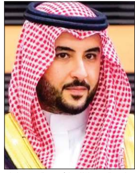
صاحب السمو الملكي الأمير خالد بن سلمان بن عبدالعزيز وزير الدفاع السعودي

عواصم - وكالات: وجّه صاحب السمو الملكي الأمير خالد بن سلمان بن عبدالعزيز وزير الدفاع السعودي كفل مشاركة الجنوبيين في السلطة، وفتح الطريق نحو حل عادل لقضيتهم يتوافق عليه الجميع من خلال الحوار دون استخدام القوة. وأشار إلى أن دعم المملكة شمل الجوانب السياسية والاقتصادية والتنموية والإنسانية، بما أسهم في تخفيف معاناة الشعب اليمني وتعزيز صموده في مواجهة التحديات، مؤكدا أن التضحيات الملكية وشركائها في التحالف