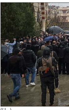
تشيع ضحايا تفجير مسجد الإمام علي بن أبي طالب في مدينة حمص

وكالات: شيعت محافظة حمص أمس ضحايا التفجير الإرهابي الذي استهدف مسجد الإمام علي بن أبي طالب في حي وادي الذهب، حيث ووري خمسة من الضحايا الثرى في مقبرة الفردوس بحمص، فيما نقلت جثامين الضحايا الآخرين إلى مساقط رأسهم في مناطق أخرى. وقالت وكالة الأنباء السورية «سانا» إن المئات من أهالي حمص، وممثلين رسميين وشعبيين، شاركوا في التشييع، وأكد إمام وخطيب مسجد علي بن أبي طالب، الشيخ محي الدين سلوم، في كلمة ألقاها خلال مراسم التشييع، أن التفجير يشكل محاولة بائسة من أعداء سورية للنيل من وحدة الشعب السوري وزعزعة استقراره، مشددا على أن مثل هذه الأعمال لن تضعف إيمان السوريين بقوة السلم الأهلي، وأن