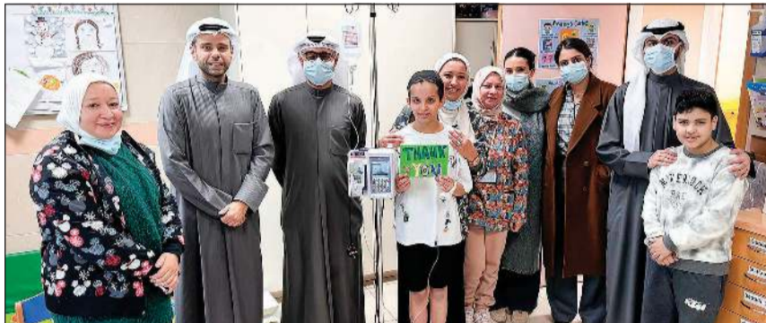
صورة جماعية لفريق «إنفست جي بي» خلال زيارتهم لجمعية رعاية الأطفال في المستشفيات الكويتية وبيت عبدالله لرعاية الأطفال