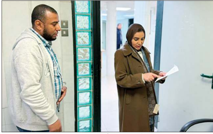
وزيرة الشؤون الاجتماعية وشؤون الأسرة والطفولة د.أمثال الحويلة خلال زيارتها لمجمع رعاية المعاقين

كما قامت الوزيرة بالاطمئنان على الحالات الموجودة في المجمع، والتأكد من توافر الرعاية اللازمة لهم، مشددة على أهمية حسن التعامل، وسرعة الاستجابة، وتقديم أفضل مستوى من الخدمات الإنسانية والاجتماعية، ويعزز استقرارهم النفسي وفق الضوابط المعتمدة.