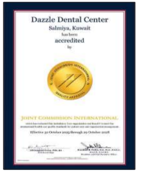
شهادة الاعتماد الدولي