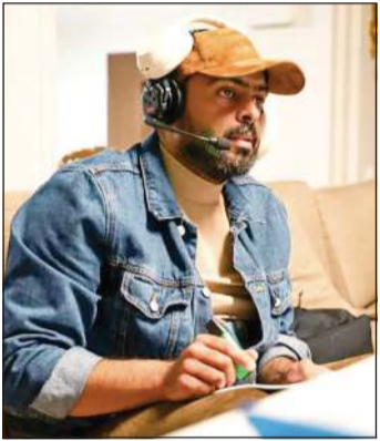
المخرج منصور حسين المنصور

نعيشه في وطننا العربي، متمنيا أن يجد القبول عند المشاهدين لدى عرضه على شاشة تلفزيون الكويت في شهر رمضان المقبل، وذلك من خلال الرؤية الإخراجية التي وضعها المنصور بتصوير مشاهد المسلسل حتى تصل رسالة المسلسل الإنسانية عندما يصبح «الصبر صرخة» لكنها لا تُسمع!