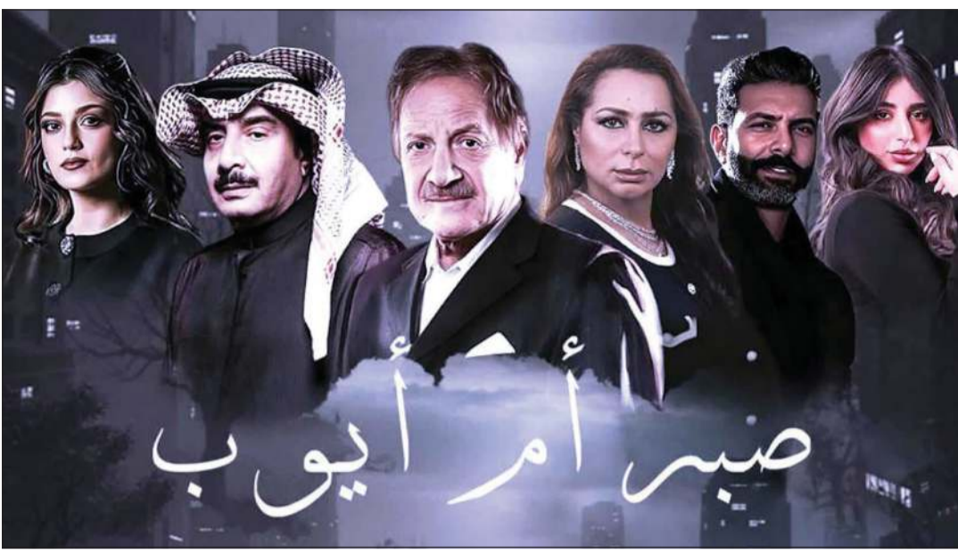
مسلسل يقع في 10 حلقات من إنتاج «سفن ستايل للإنتاج الفني»