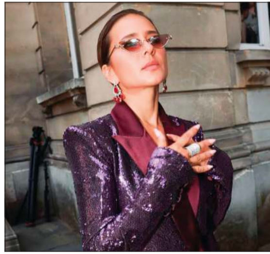
الفاهرة - محمد صلاح

ندوة صحافية لإطلاق البوستر الرسمي للفيلم: «ينتمي الفيلم إلى نوعية الأعمال الرومانسية الكوميدية التي أعشقها منذ زمن، فانا عاشقة للأفلام القديمة بالأبيض والأسود، فهي أفلامى المفضلة لأنها تجعلنا نشعر بالتفاؤل والاستمتاع، كما أنني سعيدة بالتعاون مع المخرجة أميرة دياب في أولى تجاربها الإخراجية»، مؤكدة أن الحماسة التي ترافق البدايات تعطي العمل طعما خاصا، وواصفة التجربة بالمتعة والعظيمة.