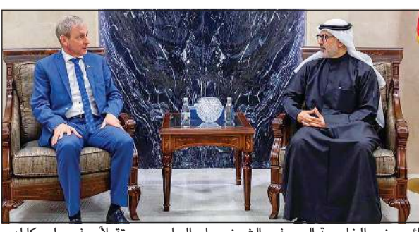
نائب وزير الخارجية السفير الشيخ جراح الجابر مستقبلاً سفير بلجيكا لدى الكويت كريستيان دومز

كونا: استقبل نائب وزير الخارجية السفير الشيخ جراح الجابر أمس الخميس سفير مملكة بلجيكا لدى الكويت كريستيان دومز، حيث تم بحث العلاقات الثنائية بين البلدين والقضايا محل الاهتمام المشترك.