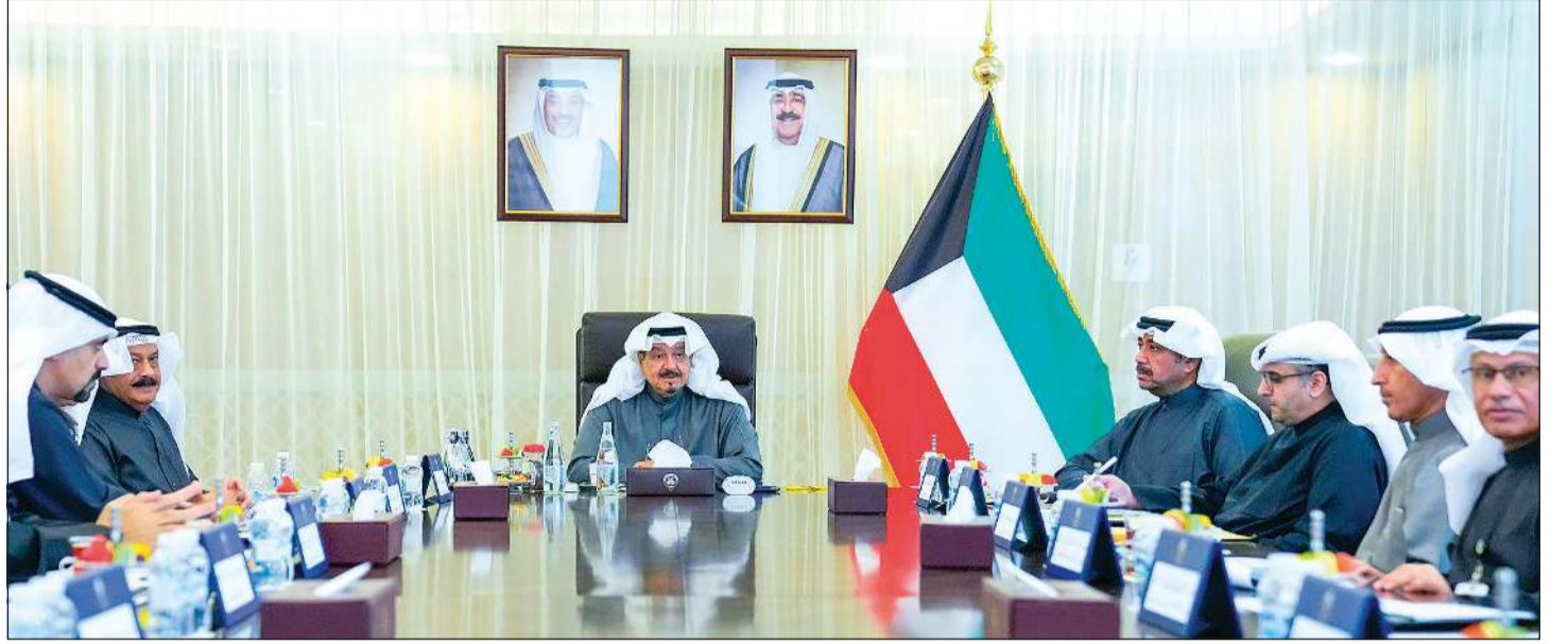
سمو الشيخ أحمد عبدالله مترأساً لاجتماع اللجنة الوزارية الـ 40 لمتابعة تنفيذ المشاريع التنموية الكبرى في البلاد