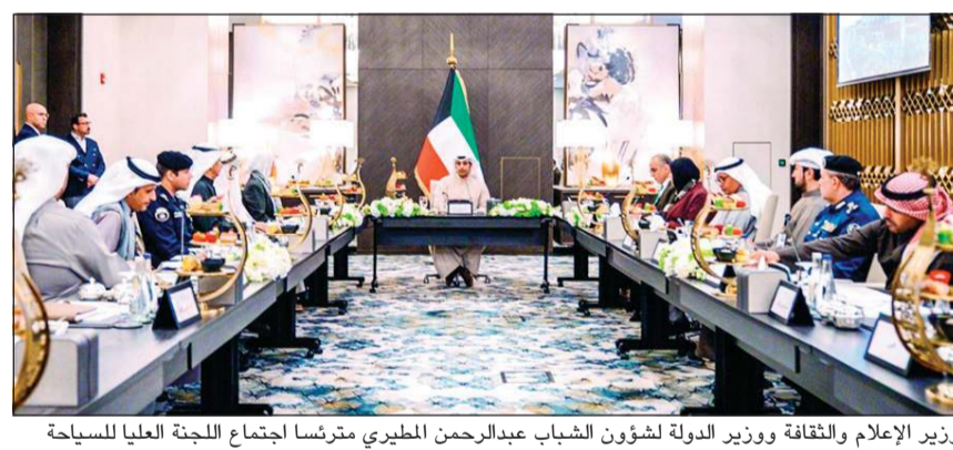
وزير الإعلام والثقافة ووزير الدولة لشؤون الشباب عبدالرحمن المطيري مترأساً لاجتماع اللجنة العليا للسياحة

المقبلة ستكون لجنة هيكلة خاصة في مؤسسات الدولة ترتبط بشكل كبير وسيكون تنفيذها لكل المشاريع متسقاً مع استراتيجية متوافقة مع سياسة الدولة في تطوير وتنشيط قطاع السياحة حتى الوصول إلى أرقام دقيقة حول أعداد السياح ومستوى الفعاليات والأنشطة الاقتصادية وسائر الأنشطة التي تقدمها لتكون لدينا مرجعيات تعتمد عليها ونقدمها لأي مؤسسة تحتاج هذه المعلومات داخل الكويت أو خارجها.