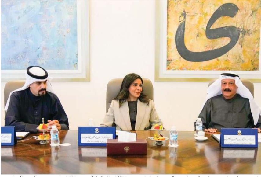
رئيس ديوان رئيس مجلس الوزراء عبدالعزيز الدخيل ووزيرة الأشغال العامة د.نورة المشعان ومدير عام هيئة تشجيع الاستثمار المباشر الشيخ د.مشعل جابر الأحمد