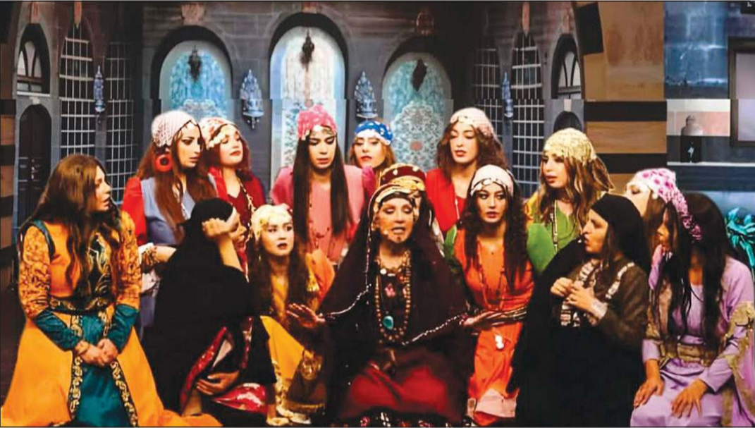
موصلي في مشهد من «عرس مطنطن»