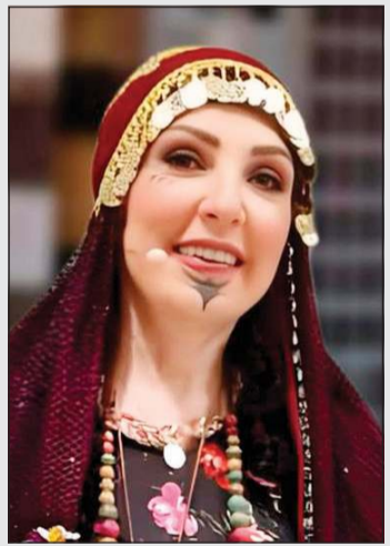
وفاء موصلي في المسرحية