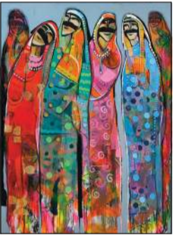
من أعمال جابر خضير