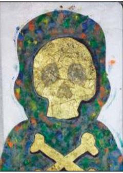
من أعمال سعد الشامري