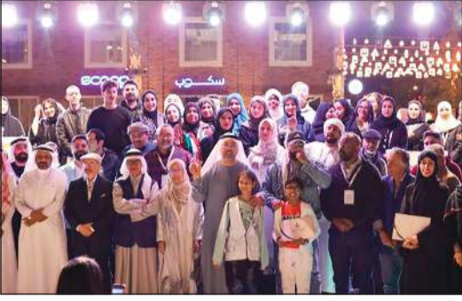
جانب من حفل الختام