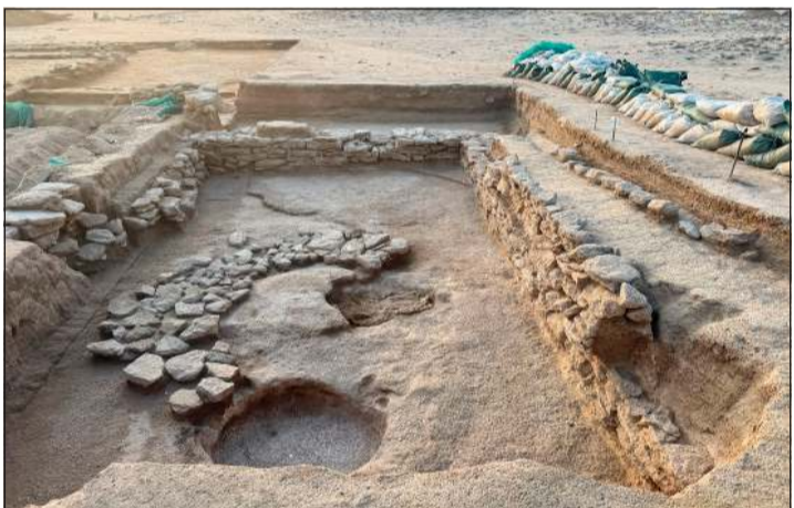
طبقات استيطانية متعددة في موقع القصور