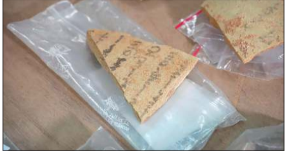
قطعة فخارية منقوشة بالخط السرياني تعرف بالواستراكا