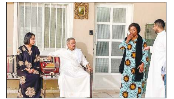
«أبو خالد» أثناء تصوير «ياكم الحزرة»