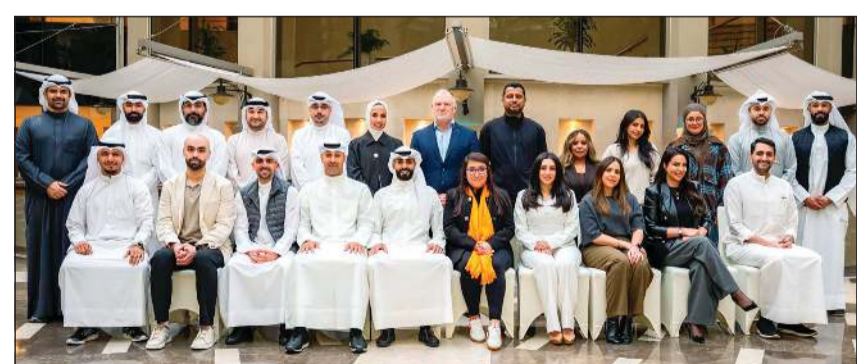
لقطة جماعية للمشاركين في البرنامج

في إطار التزام بنك الخليج بتنمية الكفاءات الوطنية وتعزيز التميز المؤسسي، أطلق البنك برنامج «Beyond AJYAL»، بالتعاون مع مؤسسة «Euromoney Learning»، إحدى المؤسسات الدولية الرائدة في مجال التدريب المصرفي والمالي والقيادي. ويعد برنامج «Beyond AJYAL» برنامجاً متقدماً صمم خصيصاً لتأهيل القيادات الكويتية الوسطى من شغلي المناصب الإدارية، وإعدادهم لقيادة المستقبل بما يواكب توجهات ومركزات رؤية الكويت، لاسيما محور رأس المال البشري الإبداعي. ويهدف البرنامج إلى تطوير المهارات القيادية المتقدمة، وتمكين الكوادر الوطنية من تولي مناصب قيادية مستقبلية، وتعزيز قدرتهم على التكيف مع متطلبات البيئة الاقتصادية المتغيرة، إلى جانب دوره البارز في دعم خطة التكوين والاستراتيجية البنك للنمو المستدام. ويهدف البرنامج إلى تعزيز قدرات المشاركين في إدارة الأعمال والتسويق، والتعامل مع التحديات، والتفكير النقدي، والتواصل الفعال، التفكير التصميمي وبيئة العمل والمهارات التطبيقية.