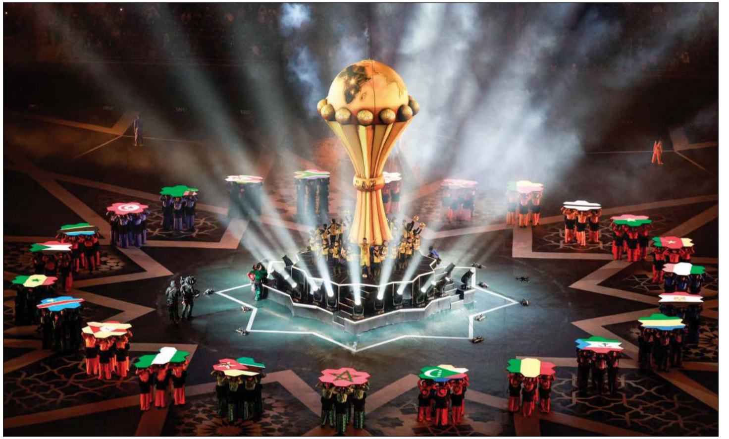
افتتاح مهجر لبطولة كأس أمم أفريقيا في نسختها الـ35