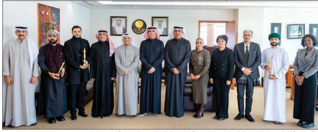
لقطة جماعية للمكرمين من المعهد العالي للفنون المسرحية والمعهد العالي للفنون الموسيقية