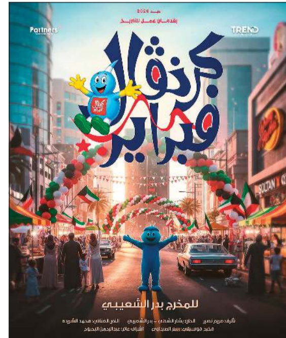
للمخرج بدر الشعبي

أعلن الفنان بدر الشعبي عن أول مفاجئته لعام 2026، كاشفا عن عمل مسرحي جديد يحمل طابعا وطنيا بعنوان «كرنقال فبراير»، والذي من المقرر تقديمه فترة عيد الفطر المقبل، لافتا إلى أن العمل يستعرض أهم مراحل تاريخ الكويت، بدءا من أيام البحر مروراً بالإنجازات والتطور في كل المجالات ومنها الفن والرياضة، ثم مرحلة الغزو الغاشم والتحرير، ما شهدته الكويت من عمران وتطور بعد الغزو، وصولا إلى أزمة كورونا، وانتهاء بالعيد الزاهر لصاحب السمو الأمير الشيخ مشعل الأحمد، حفظه الله ورحاه.