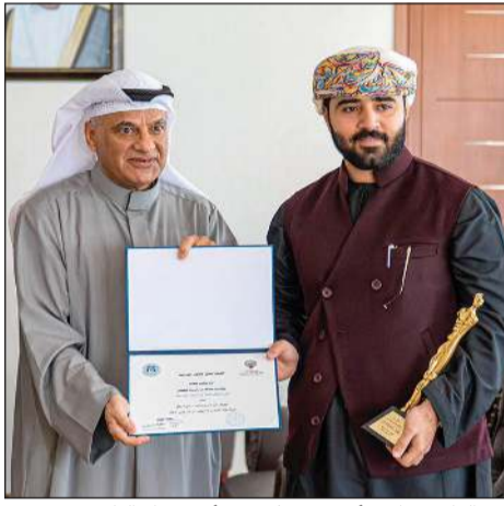
.. والفائز بجائزة أفضل ممثل دور أول جهاد البلوشي