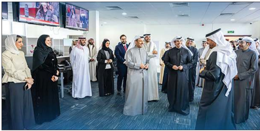
وزير الإعلام والثقافة ووزير الدولة لشؤون الشباب عبدالرحمن المطيري ووزير الإعلام البحريني د.رمزان النعيمي خلال جولة في مبنى إذاعة البحرين والاستديو الرئيسي لمركز الأخبار

فيما أكد الجانبان عمق العلاقات الأخوية الوطيدة بين البلدين الشقيقين والروابط التاريخية الراسخة والأسس المتينة من التعاون والتكامل. وقام وزير الإعلام عبدالرحمن المطيري ووزير الإعلام البحريني د.رمزان النعيمي بجولة في مجمع وزارة الإعلام شملت مركز الاتصال الوطني والاستديو الرئيسي لمركز الأخبار ومبنى إذاعة البحرين.