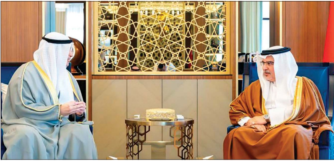
ولي العهد رئيس مجلس الوزراء البحريني صاحب السمو الملكي الامير سلمان بن حمد آل خليفة خلال استقباله وزير الإعلام والثقافة ووزير الدولة لشؤون الشباب عبدالرحمن المطيري