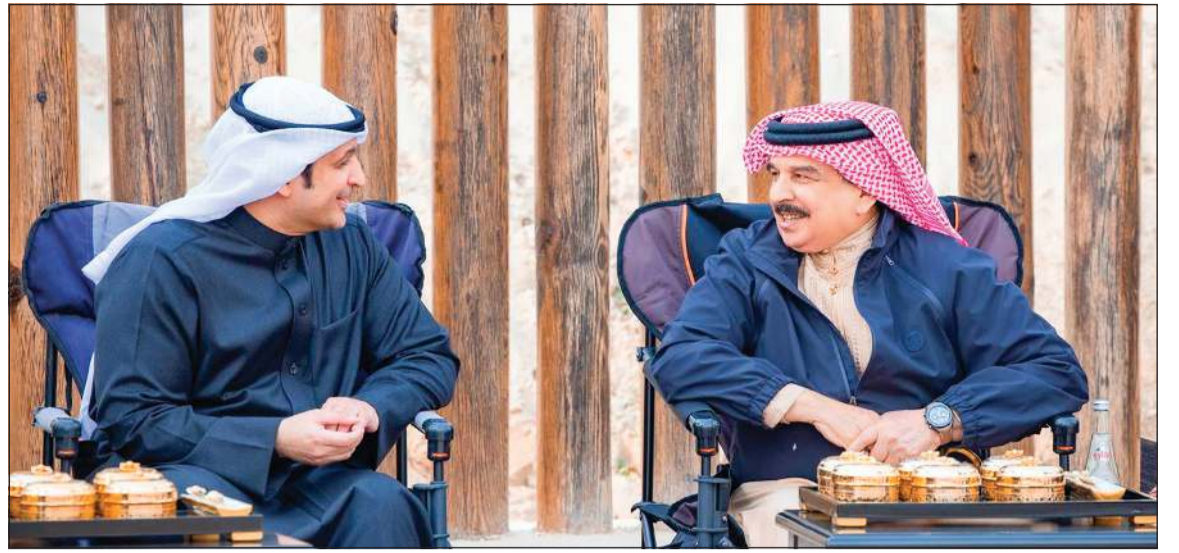
ملك البحرين الملك حمد بن عيسى آل خليفة مستقبلاً وزير الإعلام والثقافة ووزير الدولة لشؤون الشباب عبدالرحمن المطيري بمناسبة زيارته للمملكة

أنشاد لدى استقباله وزير الإعلام بالدور الكبير لصاحب السمو في دعمها وتوطيدها في جميع المجالات