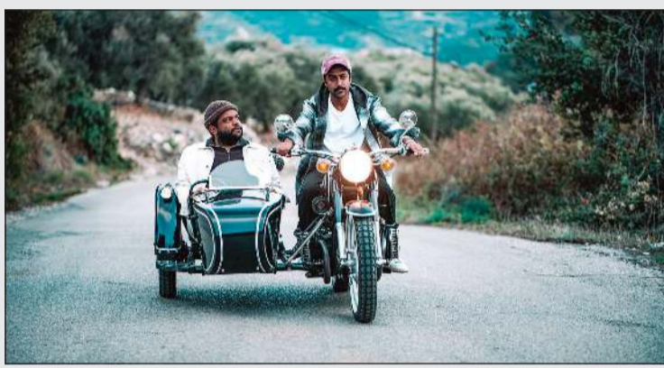
مشهد من العمل

ويضيف: احب ان اتقدم بالشكر لوزير الاعلام عبدالرحمن المطيري ووكيل الاذاعة والتلفزيون تركي المطيري لأنهم عطونا فرصة كبيرة بمشاركة زملائي اننا نقدم 10 حلقات وهالشري راح يشكل منافسة جميلة بيننا كمنتجيين وفنانين ويا رب تكون عند حسن الظن.