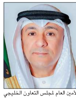
الأمين العام لمجلس التعاون الخليجي جاسم البديوي

الرياض - كونا: رفع الأمين العام لمجلس التعاون لدول الخليج العربية جاسم البديوي أسمي آيات التهاني وأصدق عبارات التبريكات إلى مقام صاحب السمو الأمير الشيخ مشعل الأحمد بمناسبة الذكرى الثانية لتولي سموه مقاليد الحكم. وقال البديوي في تصريح لـ «كونا» «أسأل الله العلي القدير أن يمد صاحب السمو الأمير بموفور الصحة والعافية وأن يوفقه لمواصلة قيادة دولة الكويت نحو مزيد من التقدم والازدهار ونحو آفاق أرحب، وأن يحفظ الله الكويت وشعبها ويديم عليها نعمتي