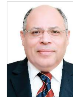
السفير المصري محمد أبو الوفا