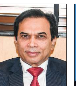
السفير الباكستاني د.ظفر إقبال