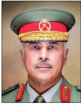
الفريق الركن حمد البرجس

قادة وقوات - يطيب لنا أن نرفع إلى مقام صاحب السمو أسمي التهاني والتبريكات بمناسبة الذكرى الثانية على تولي سموه مسند الإمارة، وتولي سموه العهد والوفاء مجددين لسموه العهد والوفاء على مواصلة العمل والبذل والعطاء لخدمة الوطن والمبذل والدفاع عنه وحفظ أمنه واستقراره وبذل الغالي والنفيس من أجل الدفاع عنه. وبهذه المناسبة نسال المولى العلي القدير أن يديم ورعاها».