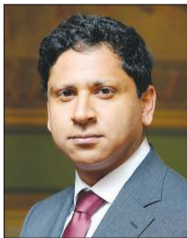
السفير البريطاني قدسي رشيد

التي تجمع بين مصر والكويت، وما تشهده من تعاون وثيق وتنسيق مستمر في مختلف المجالات، مؤكدا حرص مصر على مواصلة تعزيز كل أطر التعاون والعمل المشترك مع دولة الكويت الشقيقة، بما يحقق المصالح المتبادلة للبلدين، ويدعم مسيرة العمل