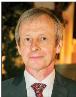
السفير البلجيكي كريستيان دومز

وأكد غابيش أن قيم الاستقرار وخدمة الصالح العام واصلت ترسيخ مكانة الكويت المرموقة على الصعيدين الإقليمي والدولي، متمنيا لدولة الكويت دوام التقدم والازدهار وللشعب الكويتي مزيدا من الاستقرار والرخاء في ظل القيادة الحكيمة لسمو الأمير.