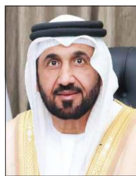
رئيس البرلمان العربي محمد اليماني

شاملة، وكذلك بجهودها، بقيادة سموه، في دعم العمل العربي المشترك ودعم القضايا العربية وتعزيز التضامن العربي. وتضرع إلى الله بأن ينعم على سموه بموفور الصحة والعافية، وأن يوفق سموه لمواصلة قيادة مسيرة البناء والتنمية في دولة الكويت نحو مزيد من التقدم والازدهار.