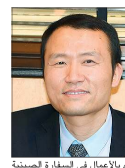
القائم بالأعمال في السفارة الصينية المستشار ليو شيانغ