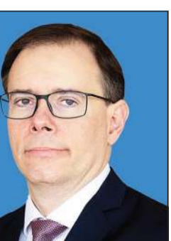
السفير البرازيلي رودريغو غابيش