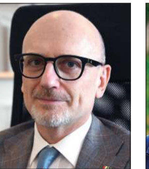
السفير الايطالي لورينزو موريني