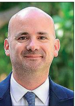
السفير الفرنسي أوليفييه غوفان