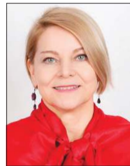
سفيرة الاتحاد الأوروبي آن كويستين