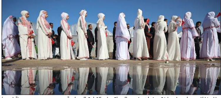
حفل زفاف جماعي في غزة بعنوان «نحب الحياة رغم الإبادة الجماعية»

عواصم - وكالات: دعت حركة «حماس» أمس واشنطن للضغط على الاحتلال للالتزام باستحقاقات وقف الحرب وإدخال إغاثة وإيواء حقيقي وفتح المعابر، في وقت حثت فيه الأمم المتحدة و200 منظمة إغاثة دولية المجتمع الدولي للضغط على إسرائيل لرفع القيود التي تعزل العمل الإنساني في الأراضي الفلسطينية، لاسيما في قطاع غزة. وقال الناطق باسم حركة «حماس» حازم قاسم، في تصريح صحفي، إن استمرار استشهاد الأطفال في غزة - الذين كان آخرهم طفل في خان يونس - بسبب البرد الشديد وسكني الخيام وعدم وجود الإيواء المناسب، يشكل جريمة واضحة يرتكبها الاحتلال بمواصلة حصاره للقطاع ومنع الإعمار بعد حرب الإبادة الصهيونية ضد قطاع غزة. ودعا إلى تحرك جاد وحقيقي من المجتمع الدولي لإغاثة غزة قبل تفاقم الكارثة ووقوع فترات جماعية بسبب البرد وعدم وجود إيواء أو مواد تدفئة. كما دعا الإدارة الأمريكية والرئيس دونالد ترامب للضغط على الاحتلال للالتزام باستحقاقات وقف الحرب على قطاع غزة، وإدخال إغاثة وإيواء حقيقي وفتح المعابر. وكانت بدأت في الـ 18 من الشهر الماضي أولى جلسات المحاكمة العلنية لـ 14 متهمًا بارتكاب انتهاكات خلال أحداث الساحل في قصر العدل بحلب بحضور ذوي الضحايا.