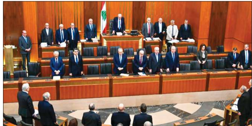
رئيس مجلس النواب نبيه بري مترشحا للجلسة العامة

بيروت - ناجي شربل وأحمد عز الدين وبولين فاضل: ما سمح به رئيس مجلس النواب نبيه بري في الجلسة التشريعية في 28 أكتوبر لجهة عدم توفير النصاب لعدد الجلسة وبدا حينذاك انتصارا لموقف «القوات اللبنانية» بالدرجة الأولى على رئيس البرلمان وتسجيل نقطة عليه، أو بالأحرى معادلة النتيجة في مواجهة أو الكباش، رد عليه بري بتوفير النصاب والتأمم الجلسة وكان في ذلك «ردة أجر» من قبله على رئيس «القوات» د.سمير جعجع وحلفائه. وكان الأبرز في الجلسة التشريعية إقرار مجلس النواب مشروع القانون المتعلق بإعادة الإعمار وترميم البنى التحتية باتفاق مع البنته الدولي والبالغة قيمته 250 مليون دولار، مع تسجيل اعتراض نواب «التيار الوطني الحر» وبعيدا عن السجلات السياسية والإقتسامات الداخلية، تعمل الحكومة اللبنانية على أكثر من ملف حساس وديق، لمواجهة الاستحقاقات المقبلة، مستفيدة من الزخم الإقليمي والدولي لإبعاد شبح الحرب في ظل التهديد والتحويل الإسرائيلي، سواء من خلال التواصل النائم مع عواصم دول القرار، أو من خلال لجنة الإشراف على وقف إطلاق النار (الميكانيزم) التي ستكون لها محطة مهمة اليوم، يؤكد خلالها الوفد اللبناني على النقاش بانفتاح كامل تحت سقف النوايا والسيادة الوطنية، بما يؤمن الاستقرار الأمني جنوبا والانسحاب الإسرائيلي من المناطق المحتلة، كي يستكمل الجيش اللبناني الإسماك بكل مفاصل الأمن جنوب اللطاني، وتعليقا على الغارات الإسرائيلية التي استهدفت أمس مناطق لبنانية عدة في البقاع والجنوب، التي أدت إلى وقوع إصابات، قال رئيس مجلس النواب نبيه بري «هي رسالة إسرائيلية مؤتمرة بباريس المخصصة لدعم الجيش اللبناني، وبالنوازي هي حزام ناري من الغارات الجوية تكريما لاجتماع الميكانيزم».