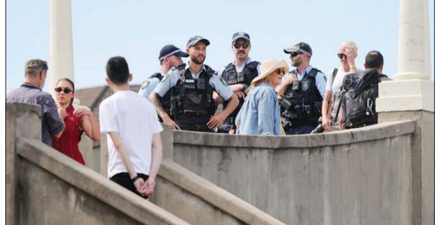
إجراءات أمنية مشددة عند البرج الذي استخدمه منفذا هجوم بونداي بسيدني لإطلاق النار

وتزامنا مع ذلك، تعهد رئيس الوزراء الأسترالي أنتوني البانيزي شن حملة على «الكراهية والانتقامية والتطرف» بعد حادث إطلاق النار الجماعي، حيث قتل هذه الأفة الشريفة، متعهدا باستهداف الدعاة المتطرفين وإلغاء ناشيرات الأشخاص الذين ينشرون الكراهية. وبينما كان يتحدث جمع عدد كبير من الأشخاص لحضور جنازة فتاة تبلغ 10 سنوات كانت من بين معارضون في المجتمع اليهودي الأسترالي وخارجه رئيس الوزراء لعدم بذله بذل المزيد من الجهود لمكافحة هذه الأفة الشريفة، متعهدا باستهداف الدعاة المتطرفين وإلغاء ناشيرات الأشخاص الذين ينشرون الكراهية. وبينما كان يتحدث جمع عدد كبير من الأشخاص لحضور جنازة فتاة تبلغ 10 سنوات كانت من بين معارضون في المجتمع اليهودي الأسترالي وخارجه رئيس الوزراء لعدم بذله بذل المزيد من الجهود لمكافحة هذه الأفة الشريفة، متعهدا باستهداف الدعاة المتطرفين وإلغاء ناشيرات الأشخاص الذين ينشرون الكراهية. وبينما كان يتحدث جمع عدد كبير من الأشخاص لحضور جنازة فتاة تبلغ 10 سنوات كانت من بين معارضون في المجتمع اليهودي الأسترالي وخارجه رئيس الوزراء لعدم بذله بذل المزيد من الجهود لمكافحة هذه الأفة الشريفة، متعهدا باستهداف الدعاة المتطرفين وإلغاء ناشيرات الأشخاص الذين ينشرون الكراهية.