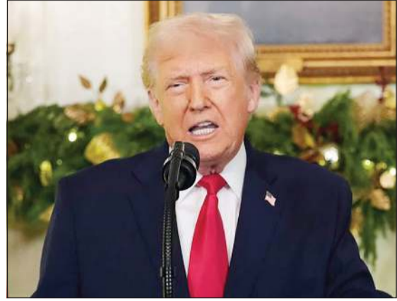
الرئيس الأمريكي دونالد ترامب يخاطب الأمة الأمريكية من البيت الأبيض

واشنطن - وكالات: عدد الرئيس الأمريكي دونالد ترامب إنجازات إدارته قائلا: أنها تمكنت في 11 شهرا تولى فيها الحكم من تحقيق العديد من التغييرات الإيجابية والإنجازات لاسيما في المجالات الاقتصادية والأمنية والعسكرية والسبائية. وألقى دونالد ترامب مساء أمس الأول خطابا قصيرا بمناسبة نهاية العام، أكد فيه مواصلة مساره الاقتصادي، فيما انتقد سلفه الديمقراطي جو بايدن وهاجم المهاجرين بغضب. وبدأ ترامب خطابه بالقول «مساء الخير يا أمريكا. قبل 11 شهرا ورثت كارثة وأنا بصدد إصلاحها». لكن الخطاب الذي بث مباشرة خلا وقت التغطية المسائية، كان مقتضيا لتخلله الاعلان عن تقديم شبكات قيمة 1776 دولارا، (الرقم يرمز إلى تاريخ إعلان استقلال الولايات المتحدة) لـ 1,45 مليون جندي أمريكي. وأضاف «بعد 11 شهرا.. حدودنا آمنة وتم كبح التضخم وارتفعت الأجور وانخفضت