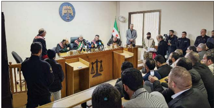
الجلسة الثانية من محاكمة المتهمين بأحداث الساحل (سنا)