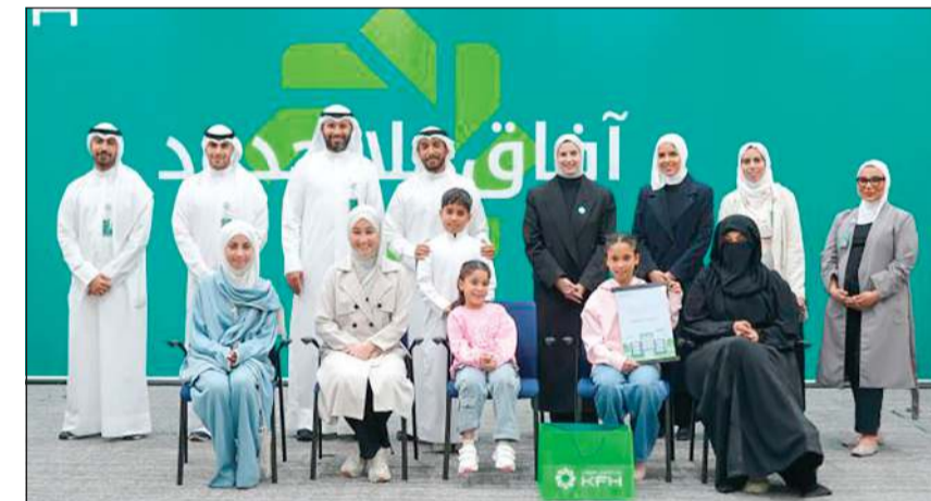
جانب من تكريم الفائزين في إحدى المسابقات

في أذربيجان، ما يوفر لعملاء «السريلانكية» بوابة جديدة نحو أوروبا عبر الكويت. وقال رئيس مجلس إدارة الخطوط الجوية الكويتية الكابتن عبدالمحسن الفقعان: في تعزيز موقع الكويت كمركز محوري يربط بين الشرق والغرب، مبينا أن الخطوط الجوية الكويتية قد أطلقت رحلاتها المجدولة إلى