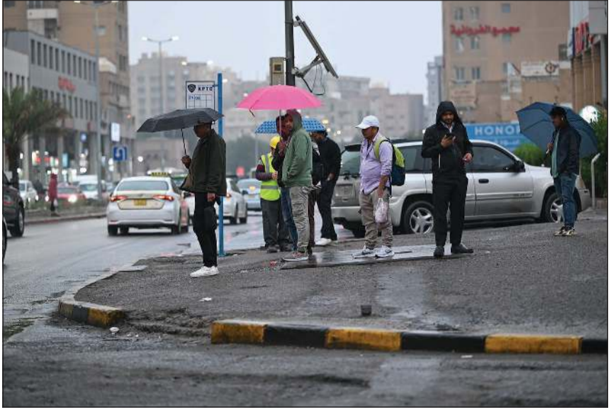
أمطار متفرقة على مناطق البلاد (أحمد علي)

إلى معتدلة السرعة ما بين 12 و35 كيلومترا في الساعة مع فرصة لتكوّن الضباب الخفيف على بعض المناطق أما درجات الحرارة الصغرى المتوقعة فتتراوح ما بين 6 و8 درجات مئوية ويكون البحر خفيفا إلى معتدل الموج ما بين 2 و4 أقدام. وعن الطقس نهار غد السبت قال العلي إنه يكون مائلا للبرودة والرياح شمالية غربية إلى متقلبة الاتجاه معتدلة السرعة ما بين 6 و28 كيلومترا في الساعة وتتراوح درجات الحرارة العظمى المتوقعة ما بين 16 و18 درجة مئوية ويكون البحر معتدلا إلى عالي الموج ما بين 4 و7 أقدام. ولفت إلى أن الطقس اليوم الجمعة ليلا يكون باردا والرياح شمالية غربية إلى معتدلة الاتجاه خفيفة إلى معتدلة السرعة ما بين 8 و30 كيلومترا في الساعة وتظهر بعض السحب المفرقة بينما درجات الحرارة المتفرقة المنووعة ما بين 7 و5 درجات مئوية ويكون البحر خفيفا إلى معتدل الموج ما بين 1 و4 أقدام.