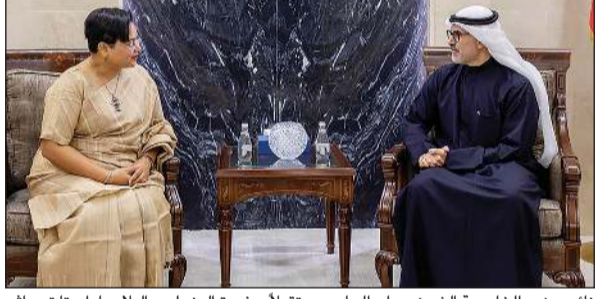
نائب وزير الخارجية الشيخ جراح الجابر مستقبلا سفير الهند لدى البلاد باراميتا تريباتي

كونا: استقبل نائب وزير الخارجية الشيخ جراح الجابر أمس الخميس سفير جمهورية الهند لدى دولة الكويت باراميتا تريباتي، حيث تم بحث العلاقات الثنائية وأبرز المواضيع على الساحتين الإقليمية والدولية.