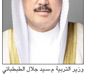
وزير التربية م.سيد جلال الطبطبائي

تاريخ صدوره، مع التأكيد على إدراج الوحدات التنظيمية المعتمدة ضمن شاشات النظم المتكاملة لديوان الخدمة المدنية، واستكمال إجراءات تسكين جميع العاملين عليها على أن يلغى كل ما يتعارض