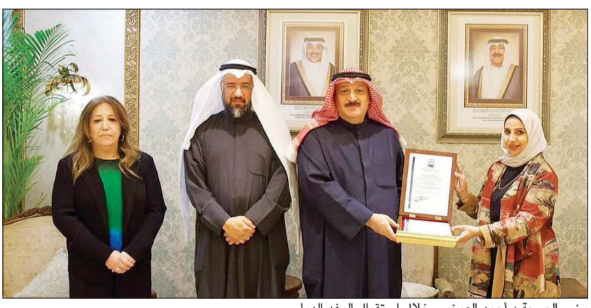
وزير الصحة د.أحمد العوضي خلال استقبال الوفد الدولي

جميع مراحل إعداد وتحضير وتخزين وتقديم الطعام، بدءاً من تسلم المواد الخام، وصولاً إلى تقديم الوجبة للمستهلك النهائي، بما يضمن الوقاية من التلوث الغذائي وتقليل المخاطر الصحية. وأوضحت وزارة الصحة أن الحصول على هذه الشهادة يعد دليلاً على الالتزام بتطبيق متطلبات ومعايير نظام تحليل المخاطر ونقاط التحكم الحرجية (HACCP) بصورة منهجية وموثقة، كما يساهم في تعزيز ثقافة الجودة والتحسين المستمر داخل مراكز إعداد الخدمات الغذائية، ورفع مستوى ثقة المرضى والمستفيدين في الخدمات الغذائية المقدمة داخل المرافق الصحية.