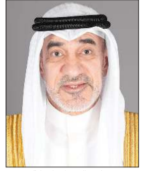
رئيس مجلس الوزراء بالإجابة ووزير الداخلية الشيخ فهد اليوسف

الوزارة تفخر بكل منتسبها وتثمن التزامهم وانضباطهم وتقدر ما يبذلونه من جهود دؤوبة في خدمة الوطن والمجتمع تحديث الإجراءات والارتقاء بالأداء وتبني الحلول التقنية الحديثة بما يساهم في دعم منتسبي الوزارة