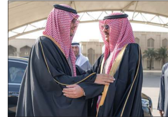
صاحب السمو الملكي الأمير تركي بن محمد بن فهد وزير الدولة عضو مجلس الوزراء بالمملكة العربية السعودية لدى مغادرته البلاد وفي وداعه وزير الدفاع ووزير الداخلية بالإبادة الشيخ عبدالله العلي والسفير السعودي سمو الأمير سلطان بن سعد