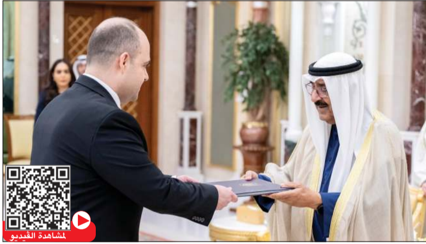
صاحب السمو الأمير الشيخ مشعل أحمد يتسلم أوراق اعتماد السفير مكسيم صبح سفيراً لجمهورية أوكرانيا

مختلف المجالات لاسيما الاقتصادية والعلمية والثقافية وبصورة عززت من المكانة الرفيعة لمملكة البحرين الشقيقة على الصعيدين الإقليمي والدولي. كما فمن سموه عمق وأصغر العلاقات التاريخية والأخوية الراسخة التي تجمع بين البلدين والشعبين الشقيقين والتأكيد على الحرص الدائم والمشارك لتعريفها والارتقاء بأفق التعاون القائم بينهما على جميع الأصعدة إلى آفاق أرحب وأشمل، سائلاً سموه جلالتة موفور الصحة وتعام العافية ولمملكة البحرين وشعبها الشقيق المزيد من التقدم والازدهار في ظل قيادته الحكيمة.