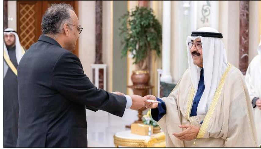
صاحب السمو الأمير الشيخ مشعل أحمد يتسلم أوراق اعتماد السفير ويريش رامسوك سفيراً لمملكة هولندا

بن عيسى آل خليفة ملك مملكة البحرين الشقيقة عبر فيها سموه عن خالص تهنأته بمناسبة الذكرى