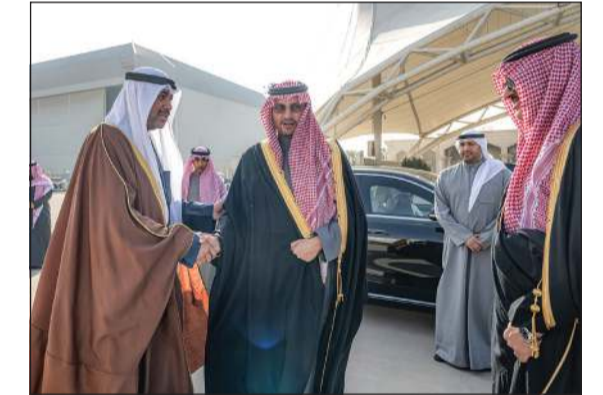
صاحب السمو الملكي الأمير تركي بن محمد بن فهد وزير الدولة عضو مجلس الوزراء بالمملكة العربية السعودية لدى مغادرته البلاد وفي وداعه وزير الدفاع ووزير الداخلية بالإبادة الشيخ عبدالله العلي والسفير السعودي سمو الأمير سلطان بن سعد

والوفد المرافق وذلك بعد زيارته الرسمية للبلاد. وقد كان في وداعه وزير