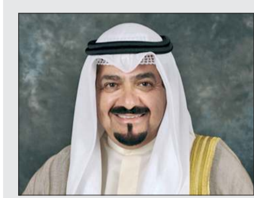
سمو الشيخ أحمد العبدالله رئيس مجلس الوزراء

كونا: احتفل في قصر بيان صباح أمس بتسليم صاحب السمو الأمير الشيخ مشعل أحمد أوراق اعتماد كل من السفير ويريش رامسوك سفيراً لمملكة هولندا والسفير محمد جابر أبو الوفا سفيراً لجمهورية مصر العربية والسفير غادي الخوري سفيراً للجمهورية اللبنانية والسفير قدسي رشيد سفيراً للمملكة المتحدة لبريطانيا العظمى وشمال أيرلندا والسفير مكسيم صبح سفيراً لجمهورية أوكرانيا وذلك كسفراء لبلادهم لدى دولة الكويت. حضر مراسم الاحتفال مدير مكتب صاحب السمو الأمير الفريقتي متقاعد جمال الذياب ووكيل الديوان الأميري الشيخ