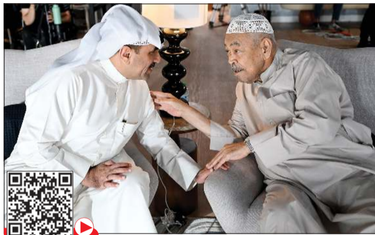
الفنان القدير سعد الفرج أثناء حديثه مع «الأنباء»