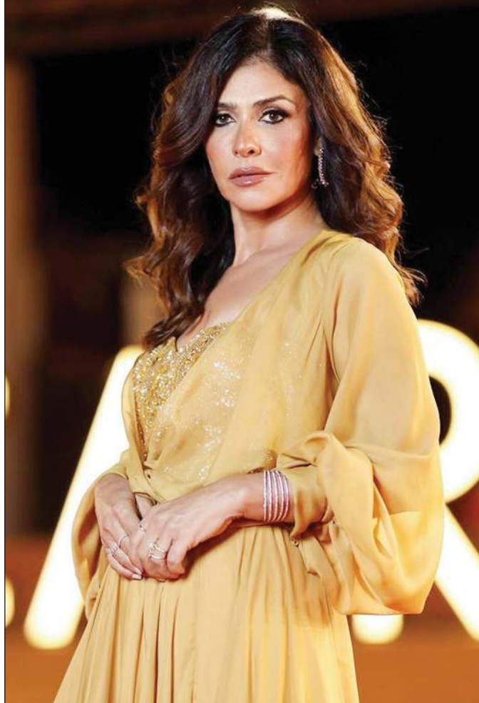
الفائزة - محمد صلاح