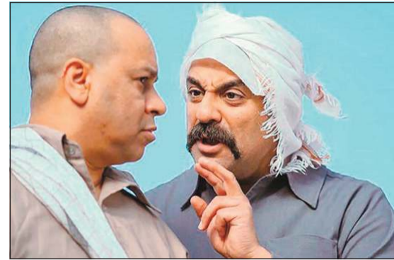
أمين في مشهد من مسلسل «محمد علي رود»