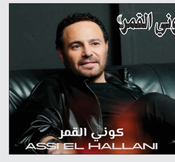
كوني القمر ASSI EL HALLANI

طرح الفنان عاصي الحلاني أحدث أغنياته «كوني القمر» ذات الطابع الرومانسي، من ألبانه، وكلمات نزار فرنسيس، وتوزيع طوني سابا وشربل عون، فيما تولى تقديم الأغنية بصريا عبر كليب يعتمد على أجواء ناعمة المخرج أحمد المنجد، وتم طرحها عبر «يوتيوب» والمنصات الرقمية. وتصريح الأغنية بين مشاعر الحب والحنين والسودق، وإحساس بالغربة والاشتباق، في قالب موسيقي يجمع بين البساطة والتعبير العميق عن المشاعر.