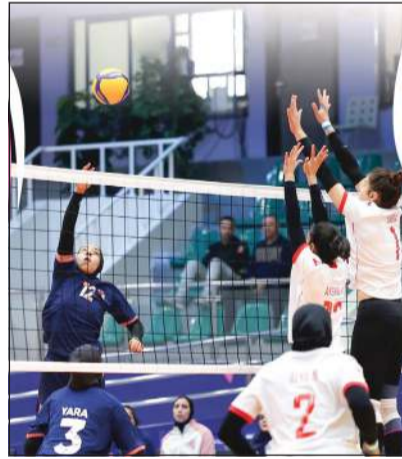
جانب من مواجهة سيدات الشارقة الإماراتي والفيحاء السعودي

تأهل فريقا الفتاة والشارقة إلى نصف نهائي بطولة أندية غرب آسيا الأولى لكرة الطائرة للسيدات، بعد تغلب الأول على سيدات نادي القلمون اللبناني 0-3، في المباراة التي جمعتهم مساء أمس على صالة المغفور له بإذن الله، الراحل العم خالد يوسف المرزوق، بنادي سلوى الصباح، بضاحية العدان، كما حسم الشارقة الإماراتي مواجهته مع الفيحاء السعودي لمصلحته 0-3 أيضاً. وقد استكملت بقية مواجهات الدور ربع النهائي للبطولة في وقت متأخر مساءً.