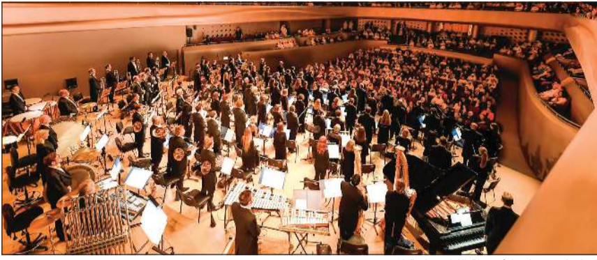
إقبال كبير على الأنشطة الكلاسيكية المميزة

كشفت مديرة عام شركة «سن» للإنتاج الإبداعي فيصل خاجة عن استضافة أوركسترا قطر الفيلهارمونية لأول مرة في الكويت، وذلك لتقديم عرضين مختلفين في مركز الشيخ جابر الأحمد الثقافي، يومي الجمعة 19 والسبت 20 من الشهر الجاري، وذلك في ختام أنشطة شركة سن للعام الحالي، بعد موسم فني حافل شهد تقديم مجموعة متنوعة من الأعمال في الكويت والخليج.