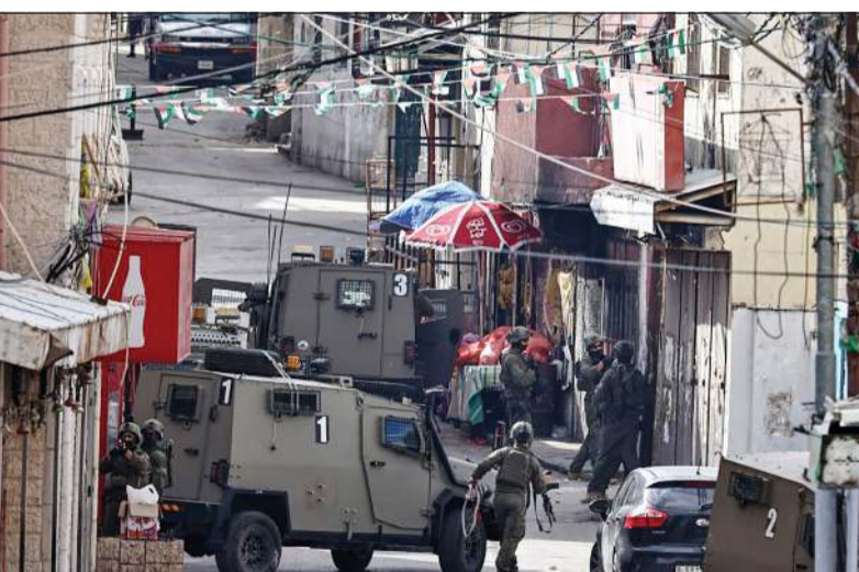
الجيش الإسرائيلي خلال اقتحام مخيم الأمعري للاجئين في الضفة الغربية المحتلة

من جهة أخرى، ندد المفوض العام لوكالة غوث وتشغيل اللاجئين الفلسطينيين (أونروا) فيليب لازاريني بمصادرة شاحنة تنقل إسرائيلية مملوكة للمنظمة الأممية في مقرها بالقدس الشرقية. وقال لازاريني عبر منصة «إكس»: «اقتحمت الشرطة الإسرائيلية برفقة مسؤولين من البلدية مجمع الأونروا في القدس الشرقية بالقوة». وأضاف أن السلطات الإسرائيلية استخدمت شاحنات ورافعات لنقل «الأثاث، الكما والتقنية، وممتلكات أخرى»، كما تم إنزال علم الأمم المتحدة ورفع العلم الإسرائيلي بدلاً منه.