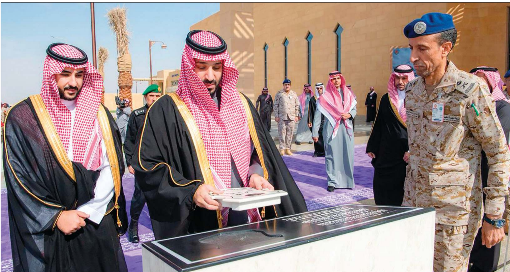
صاحب السمو الملكي الأمير محمد بن سلمان بن عبدالعزيز آل سعود ولي العهد رئيس مجلس الوزراء السعودي يفتتح مرافق قاعدة الملك سلمان الجوية بحضور صاحب السمو الملكي الأمير خالد بن سلمان بن عبدالعزيز وزير الدفاع

وتعليقا على الحدث، قال وزير الدفاع الأمير خالد بن سلمان في تصريح نقلته صحيفة الرياض: «حظينا في وزارة الدفاع برعاية وحضور ولي العهد حفل افتتاح مرافق قاعدة الملك سلمان الجوية بالطاقة الأوساط والذي يعكس اهتمامه الدائم بتطوير الوزارة لتعزيز قدراتها العسكرية والدفاعية لحماية أمن الوطن».