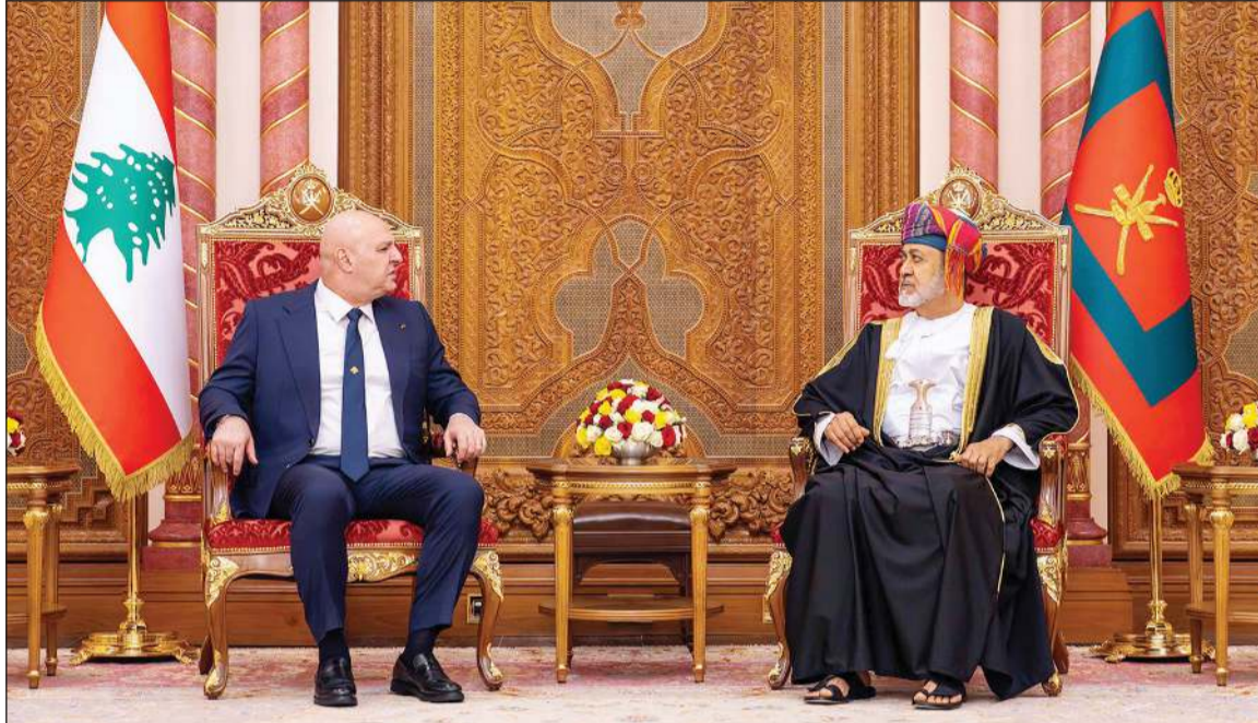
سلطان عمان السلطان هيثم بن طارق مستقبلاً الرئيس اللبناني العماد جوزف عون

وقال: لا يفتني أن أشيد بالدور الحكيم والمسؤول الذي تضطلع به سلطنة عمان الشقيقة على الصعيدين الإقليمي والدولي، تحت القيادة الرشيدة لجلالة السلطان هيثم بن طارق. إن سياسة عمان القائمة على الحوار والوساطة والتوازن وحسن الجوار قد أكسبتها مكانة مرموقة ودورا محوريا في تعزيز الاستقرار وحل النزاعات بالطرق السلمية. ونحن في لبنان نقدر عاليا هذا النهج الحكيم، ونثمّن مواقف السلطنة الداعمة للبنان في مختلف المحافل الدولية، ووقوفها إلى جانبنا في مواجهة التحديات التي نمر بها. وأضاف «إن لبنان، بموقعه الجغرافي المميز وتنوعه الثقافي وأرثه الحضاري، يتطلع إلى أن يكون جسرا للتواصل والحوار، وشريكا فاعلا في بناء منطقة يسودها الأمن والاستقرار والازدهار». وختم، اتطلع بكل ثقة إلى أن تتم هذه الزيارة عن نتائج ملموسة تعود بالنفع على بلدينا وشعبينا الشقيقين، وأن تفتح صفحة جديدة من التعاون المثمر بين لبنان وسلطنة عمان».