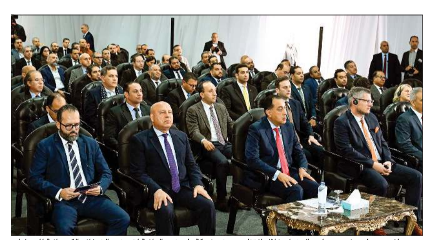
د.مصطفى مدبولي رئيس مجلس الوزراء خلال افتتاح مصنع شركة «ليون» العالمية لتصنيع الضفائر الكهربائية للسيارات

مدبولي: مصر مركز عالمي لصناعة الضفائر الكهربائية