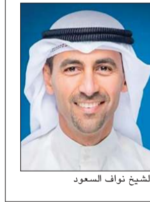
الشيخ نواف السعود

قال الرئيس التنفيذي ونائب رئيس مجلس الإدارة في مؤسسة البترول الكويتية الشيخ نواف السعود إن الكويت تستثمر بأكثر من 20 مليار دولار في الاستكشاف والإنتاج لرفع القدرة من 3 ملايين برميل يوميا إلى 3.2 ملايين ثم إلى 4 ملايين برميل. وأضاف الشيخ نواف السعود خلال منتدى جيكا السنوي في البحرين، أن العالم أمام زيادة كبيرة في الطلب على الطاقة قد تصل إلى 40٪ حتى عام 2050.