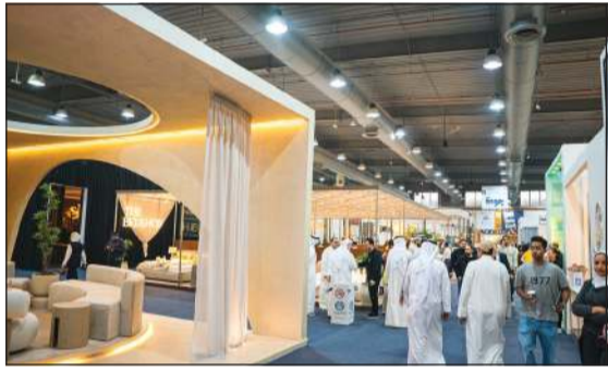
جانب من معرض «مرزام»