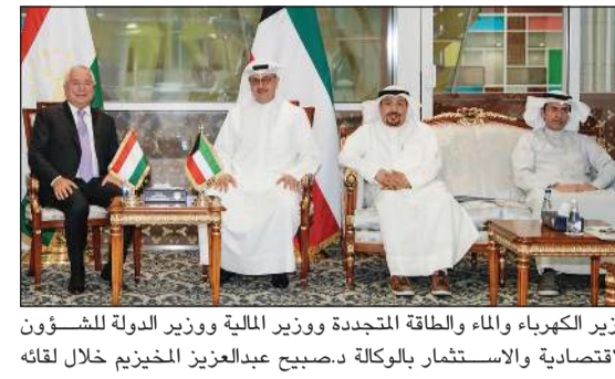
وزير الكهرباء والماء والطاقة المتجددة ووزير المالية ووزير الدولة للشؤون الاقتصادية والاستثمار بالوكالة د.صبيح عبدالعزيز المخيزم خلال لقائه مع سفير طاجيكستان وعميد السلك الدبلوماسي د. زيد الله زبيد زاده

التعاون الثنائي في عدد من المجالات ومنها التجارية، الاقتصادية والاستثمارية، والأليات الخاصة بتفعيلها والتي من أهمها عقد الدورة الخامسة للجنة الكويتية الطاجيكية المشتركة وتبادل الوفود الاقتصادية بين الجانبين. كما التقى د.صبيح المخيزم بسفير جمهورية أرمينيا لدى الكويت د.آرسين أراكيليان، حيث تم التطرق إلى عدد من المواضيع ذات الاهتمام المشترك لدى كلا البلدين وخاصة في المجال الاقتصادي، السياحي، وفي مجال قطاع الأعمال وسبل تنميتها بما يعود بالمنفعة والمصلحة المشتركة لكلا البلدين.