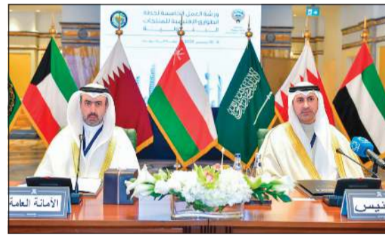
وكيل وزارة النفط الشيخ د.نمر الصباح خلال ورشة العمل الخامسة لنمذجة سيناريوهات خطة الطوارئ الإقليمية للمنتجات البترولية لدول مجلس التعاون الخليجي 2025

العملية بما يضمن استمرارية تدفق المنتجات البترولية في الظروف الطارئة. ووجدت التزام الكويت الراسخ بدعم خطة الطوارئ الإقليمية وحرصها على الإسهام الفاعل في أعمال اللجنة من خلال فرقها الفنية المتخصصة بما يعزز جاهزية دول المجلس ويرسخ منظومة العمل الخليجي المشترك في مجال أمن الإمدادات، مؤكداً أن نجاح هذه الخطة يعتمد على استمرار التعاون وتبادل الخبرات والتكامل بين القدرات الوطنية.