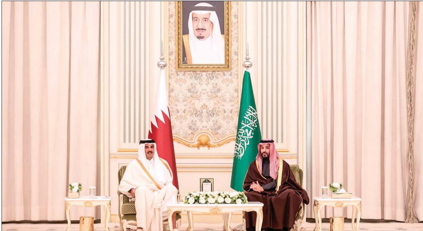
صاحب السمو الملكي الأمير محمد بن سلمان ولي العهد رئيس مجلس الوزراء السعودي وصاحب السمو الشيخ تميم بن حمد آل ثاني أمير دولة قطر خلال جلسة مباحثات في الرياض

وكالات: عقد صاحب السمو الملكي الأمير محمد بن سلمان ولي العهد رئيس مجلس الوزراء السعودي وصاحب السمو الشيخ تميم بن حمد آل ثاني أمير دولة قطر، جلسة مباحثات رسمية أمس، في قصر اليمامة بالرياض. ووفق وكالة الأنباء السعودية (واس)، استعرضت الجلسة العلاقات الراسخة بين السعودية وقطر وسبل تعزيز التعاون المشترك ويعزز العمل الخليجي المشترك. وأوضح بيان «واس» أن المباحثات تأتي في إطار العلاقات التاريخية المتينة والتنسيق المستمر في مختلف الملفات ذات البعد السياسي والاقتصادي والتنموي. وترأس صاحب السمو الشيخ تميم بن حمد آل ثاني أمير قطر وصاحب السمو الملكي الأمير محمد بن سلمان ولي العهد رئيس مجلس الوزراء السعودي الاجتماع الثامن لمجلس التنسيق السعودي - القطري بالملكة، إذ تجسد زيارة أمير قطر عمق العلاقات الثنائية للارتقاء بها إلى مستوى أرحب، كما تجدد فرص التعاون المشترك. ووفق قناة «العربية نت»، جاءت زيارة أمير قطر بعد أيام من انعقاد اجتماع اللجنة التنفيذية للمجلس في الرياض، إذ رأس الاجتماع صاحب السمو الأمير فيصل بن