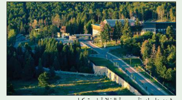
مشهد عام لمدينة بورصة الخلابة في تركيا

عريق وسط بيئة هادئة تحول رحلة العلاج إلى تجربة سفر معنوية وملهمة. ويفضل هذا الدمج الفريد بين الطب الحديث والموارد الحرارية الطبيعية. ترسخ تركيا اليوم مكانتها كوجهة إقليمية وعالمية تنمو بسرعة في مجال السياحة الصحية، مقدمة تجربة علاجية آمنة وفعالة لزوارها من الخليج والعالم، تسهم في تحقيق الشفاء وتجديد الحياة على المدى الطويل.