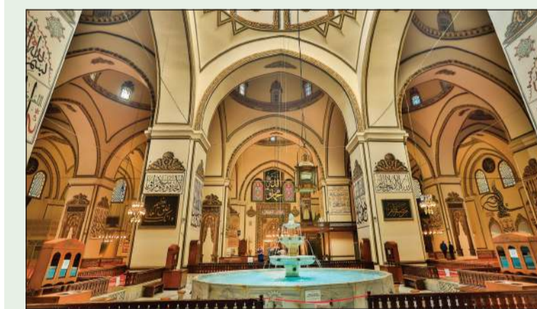
أحد المساجد التاريخية في المدينة

ويعكس هذا الإنجاز المكانة الريادية لبنك الخليج في مجال التحول الرقمي، وقدرته على تقديم حلول مصرفية تعتمد على أحدث التقنيات العالمية، وذلك عبر تنفيذ استراتيجيته الرقمية الطموحة التي تركز على تحسين تجربة العملاء ورفع مستوى الكفاءة التشغيلية. تماشياً مع أهداف التحول الرقمي، حافظ بنك الخليج