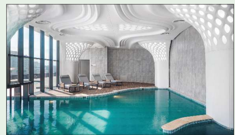
أحد المركز العلاجية في مدينة بورصة