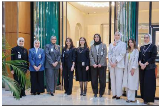
لغة جماعية للمشاركات في الفعالية