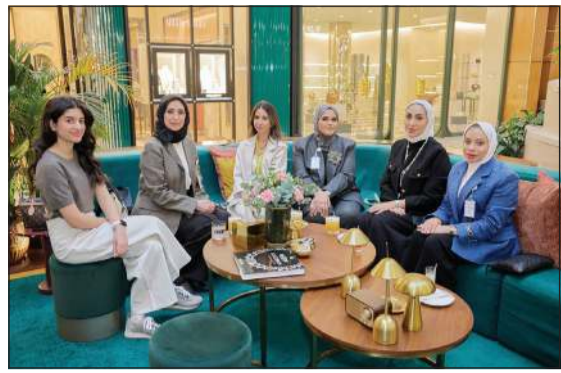
جهير معرفي خلال الفعالية مع بعض موظفات البنك

أجل منح عميلاتها الفرصة للتعرف على تاريخ الدور الرائدة في المجوهرات، وأبرز التصاميم التي توفرها في الكويت، مع السماح لهن بالحصول على خصومات عروض حصرية عند القيام بعمليات الشراء عن طريق استخدام بطاقتنا وحولنا المناسبة لهن. وتابعت أن الفعالية تشكل خطوة مهمة نحو تعزيز علاقتنا مع عميلاتها، وتقديم الشكر لهن على ثقتهن وولائهن المستمر.