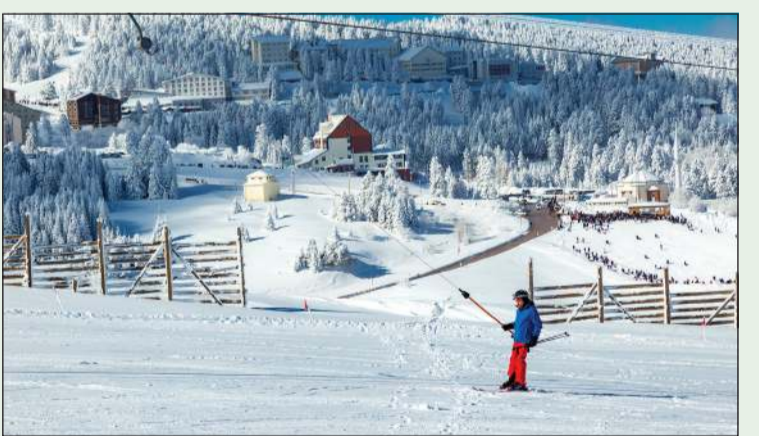
سياحة التزلج في بورصة