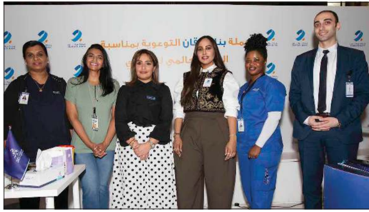
فريقاً بنك برقان ومستشفى الكويت خلال فعالية اليوم العالمي للسكري في سوق المباركية