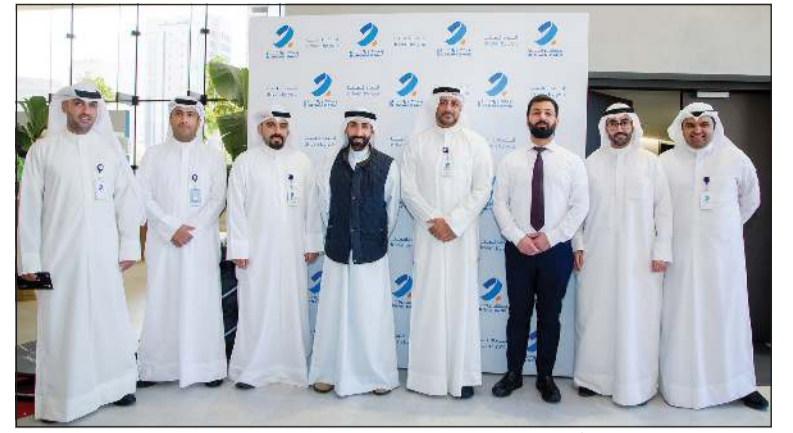
فريق البنك خلال حملة «أنت دافعا»