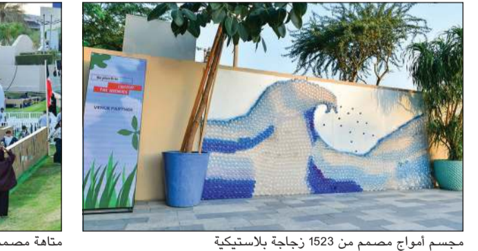
مجسم أمواج مصمم من 1523 زجاجة بلاستيكية