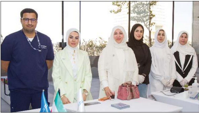
طاقم طبي من المستشفى الأميري خلال فعالية خاصة لموظفي البنك بمقره الرئيسي