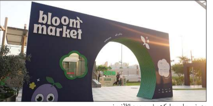
معرض «بلوم ماركت» في مجمع الأقنيوز

التغيير للأفضل وتشجيع الطاقات في مجال الاستدامة. وقالت إدارة الأقنيوز حول «بلوم ماركت»: «سعداء بالتعاون مع شركة سيدز لاحتضان «بلوم ماركت» من خلال توفير مساحة منطقة سكاى لاستضافة المعرض، حيث نشجع الطاقات الشبابية وما ينتج عنها من مشروعات مهمة ومؤثرة في مجال الاستدامة لتقديم منتجات صديقة للبيئة لزوار الأقنيوز. وأوضحت إدارة الأقنيوز أن الرعاية الاستراتيجية لفعالية «بلوم ماركت» تأتي ضمن سلسلة من المبادرات المختلفة التي يتم إطلاقها تماشياً مع برنامج الاستدامة الذي يلتزم به الأقنيوز للتركيز على زيادة الوعي وتبني ممارسات مستدامة إيجابياً على المجتمع وتشجيع الممارسات الصديقة للبيئة.