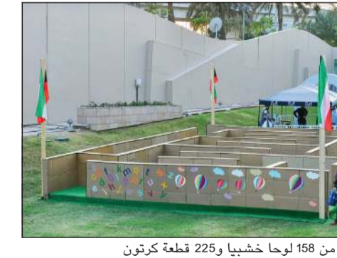
متاهة مصممة من 158 لوحاً خشبياً و225 قطعة كرتون

تماشياً مع الرحلة المستمرة نحو الاستدامة والمساهمة الفعالة نحو المجتمع والبيئة الإيجابية، احتضن مجمع الأقنيوز «بلوم ماركت»، أول معرض كويتي مستدام وصديق للبيئة، عبر شراكة استراتيجية من خلال توفير منطقة سكاى في المساحة الخارجية من الأقنيوز لإقامة المعرض، وذلك خلال الفترة من 4 حتى 6 ديسمبر الجاري. كما تضمنت مشاركة الأقنيوز في «بلوم ماركت» توفير 77 لوحاً خشبياً تم استخدامها في تصنيع المسرح المشارك في المعرض، بالإضافة إلى تصميم متاهة ضخمة مصممة من 158 لوحاً خشبياً و225 قطعة كرتون، وأيضاً مجسم أمواج مصمم من 1523 زجاجة بلاستيكية معادة الاستخدام، وقد شارك الزوار بالتجول في المتاهة في تجربة ممتعة، بالإضافة إلى التقاط الصور لأمواج الزجاجات