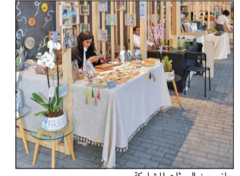
جانب من البوئات المشاركة