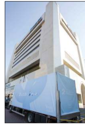
حملة «أنت دافعا»

كما شهدت الفعالية مشاركة أصحاب المشاريع الكويتية الصغيرة والمتوسطة التي تهتم بعودة الحياة الصحية ومتوازن. ومن خلال الفعالية حرص ممثلو بنك برقان على تثقيف أفراد المجتمع بحملة «لنكن على دراية» التوعوية المصرفية لمعرفة حقوقهم وواجباتهم المصرفية، ولكي يتجنبوا عمليات الاحتيال. وحرص البنك على تنظيم فعالية خاصة لموظفيه تهتم ب«صحة الرجل» في المقر الرئيسي، والتي شملت استشارات طبية وتوعوية وبشكل عام، وحول سرطان البروستاتا بشكل خاص، تحت شعار «أنت دافعا»، وبالتعاون مع طاقم طبي من المستشفى الأميري أحد أبرز المستشفيات الكويتية التي يفتخر بنك برقان بالتعاون معها في مثل هذه المبادرات. كما حرص البنك على تعزيز مكانته كجهة عمل مفضلة، بدوره كمساهم فاعل في تحقيق التنمية المجتمعية الشاملة والمستدامة.