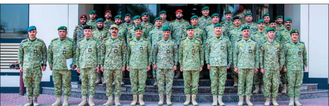
وكيل الحرس الوطني الفريق الركن حمد البرجس والمعاون للشؤون المالية وإدارة الموارد اللواء رياض محمد طواري وكبار القادة وعدد من منتسبي الحرس

معتبراً ذلك انعكاساً لروح العالية وتلبية نداء الواجب. كما ثمن البرجس الجهود المبذولة في إعداد وتنفيذ التمرين، مؤكداً دعم القيادة القتالية لمنتسبي الحرس الوطني.