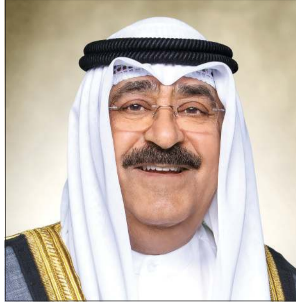
صاحب السمو الأمير الشيخ مشعل الأحمد

كونا: بعث صاحب السمو الأمير الشيخ مشعل الأحمد ببرقية تهنئة إلى أخيه الرئيس أحمد الشرع رئيس الجمهورية العربية السورية الشقيقة، عبر فيها سموه عن خالص تهانيه بمناسبة ذكرى يوم التحرير لبلاد، مشيدا سموه بالعلاقات الأخوية الوطيدة التي تجمع البلدين والشعبين الشقيقين، مؤكدا سموه التطلع الدائم والمثمر لتعزيزها إلى آفاق أرحب وأشمل في مختلف المجالات، متمنيا سموه له موفور الصحة والعافية وللجمهورية العربية السورية وشعبها الشقيق المزيد من التقدم والازدهار.