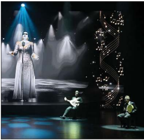
من لوحات العرض الفني

وأضاف أن المهرجان كان وما زال علامة مضيئة في غالب المهرجانات بالمنطقة وأسهم في اكتشاف وتطور أسماء لامعة من كتاب ومخرجين وممثلين قدموا اليوم نجوما يشار إليهم بالبنان وأصبحوا جزءا مهما في مهرجان الكويت المسرحي وعنوانا دائما لمساهماتهم في إنجاحه على مدى 25 نسخة من التميز والاستدامة.