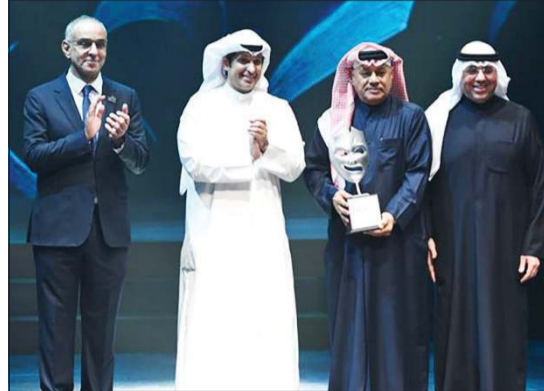
.. ومكرما ضيف شرف المهرجان الفنان القطري غانم السليبي