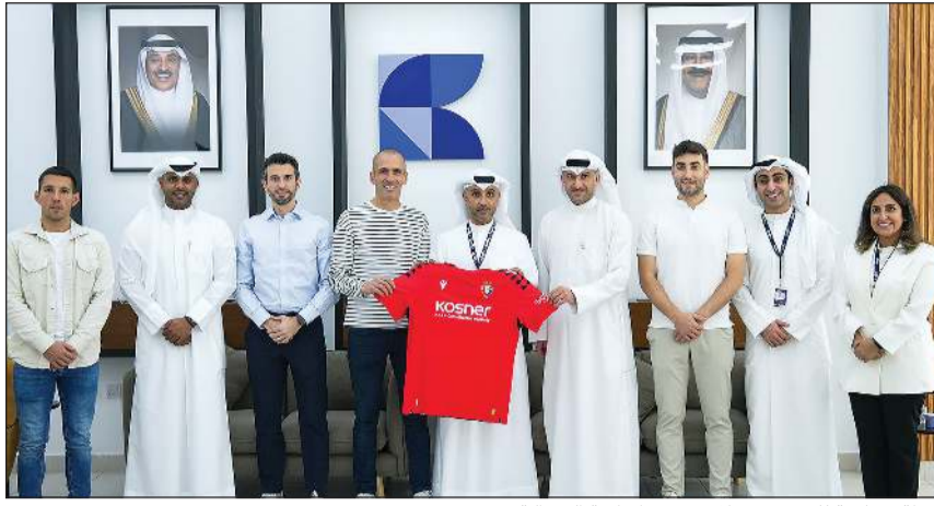
لقطة جماعية للحضور خلال توقيع اتفاقية الشراكة

وأضاف «نلتزم بمنهجية عادلة وشفافة في التقييم، بالتعاون الكامل مع خبراء أوساسونا. الهدف أن تصل التجربة إلى كل الطلبة في مختلف المراحل، لتكون تجربة احترافية حقيقية على أرض الكويت». واختتم المؤتمر بكلمة كلين أوساسونا السابق والمدير الفني لأكاديمية النادي باتشي بونال، حيث شرح الآليات الفنية لتقييم المواهب، قائلًا: «آلية التقييم تعتمد على أربعة محاور رئيسية: المهارة الفنية، الذكاء التكتيكي، الانضباط، والاستمرارية. يتم إنشاء ملف تقييم خاص لكل لاعب، ويمكن للبارزين الاستمرار معنا داخل الأكاديمية».