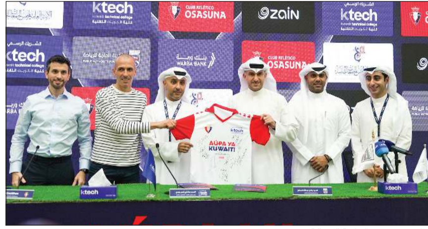
جانب من توقيع اتفاقية الشراكة

وأوساسونا تأتي في إطار استراتيجية الدولة لتعزيز مسار الاحتراف الرياضي». وأضاف «هذا المشروع ليس حدثا عابرا بل نقلة نوعية نحو بناء منظومة رياضية متكاملة تمتد من المدارس إلى الجامعات وصولا إلى الأندية المحترفة». و«وجودنا اليوم في الكويت، ولأول مرة في الشرق