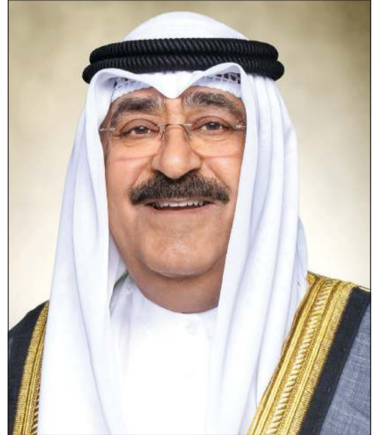
صاحب السمو الأمير الشيخ مشعل الأحمد

علاقات تاريخية وأخوية راسخة تجمع بين البلدين والشعبين وحريصون على الارتقاء بأفق التعاون إلى آفاق أرحب وأشمل