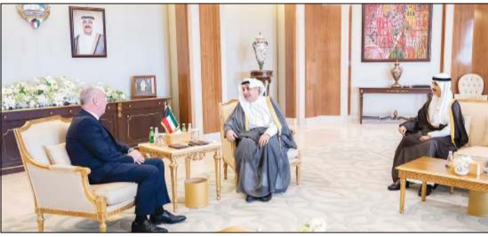
وزير شؤون الديوان الأميري الشيخ حمد جابر العلي ورئيس ديوان سمو ولي العهد الشيخ تامر الجابر خلال استقبال السفير هنغاري لدى الكويت اندراش سابو