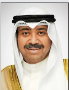
الشيخ عبدالله العلي

كوئنا: بعث وزير الدفاع الشيخ عبدالله العلي ببرقيته تهنئة إلى كل من ولي عهد دبي نائب رئيس مجلس الوزراء ووزير الدفاع بدولة الإمارات العربية المتحدة الشقيقة الشيخ حمدان بن محمد بن راشد آل مكتوم، وإلى وزير الدولة لشؤون الدفاع الإماراتي محمد بن مبارك بن فاضل المزروعى، وذلك بمناسبة الاحتفال بالعيد الوطني لدولة الإمارات العربية المتحدة الشقيقة.