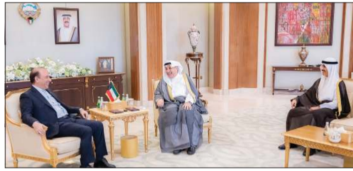
وزير شؤون الديوان الأميري الشيخ حمد جابر العلي ورئيس ديوان سمو ولي العهد الشيخ تامر الجابر خلال استقبال السفير الإيراني محمد توتونجي

بمناسبة الاحتفال بالعيد الوطني لدولة الإمارات العربية المتحدة الشقيقة. ويسرنا في هذه المناسبة العزيزة علينا جميعاً أن نعرب لسموكم عن اعتزازنا بعمق العلاقات التاريخية والروابط الأخوية المتينة بين بلدينا الشقيقين. سائلين الله سبحانه وتعالى أن يديم عليكم موفور الصحة والعافية وأن يديم على دولة الإمارات العربية المتحدة الشقيقة نعمة الأمن والاستقرار والازدهار في ظل قيادتها الحكيمة والرشيدة.