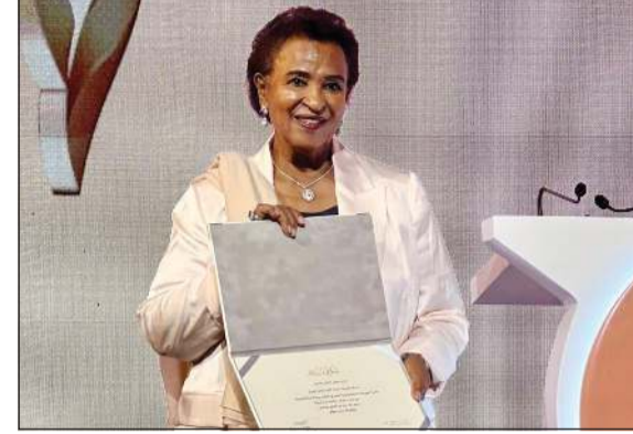
الشيخة نعيمة الأحمد

أعلن نادي سلوى الرياضي عن استضافته البطولة الأولى للسيدات في الثالث من الشهر الجاري والتي تستمر لمدة 10 أيام تحت رعاية وزير الإعلام والثقافة ووزير الدولة لشؤون الشباب عبدالرحمن المطيري. وقالت رئيس مجلس إدارة نادي سلوى الرياضي الشيخة نعيمة الأحمد الصباح أمس الإثنين في تصريح لـ «كونا» عقب المؤتمر الصحافي إن النادي استكمل كل الاستعدادات للبطولة والتي يشارك فيها 12 نادياً من دول غرب آسيا. وأكدت الشيخة نعيمة أن استضافة النادي للبطولة جاء انطلاقاً من إيمانه بدعم الرياضة النسائية في دولة الكويت وإيران تطورها في السنوات الأخيرة، مضيفاً أن الكويت باتت وجهة معروفة لتنظيم البطولات النسائية