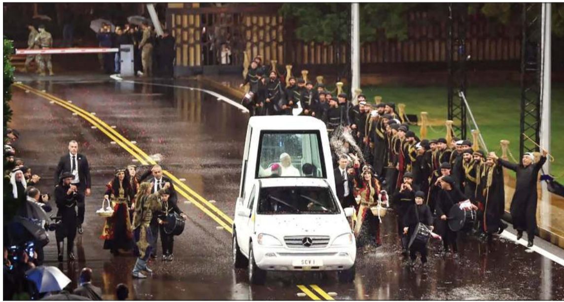
لحظة وصول بابا القاتيكان ليو الرابع عشر إلى قصر بعيدا بواسطة السيارة البابوية (محمود الطويل)

الرئيس سعد الحريري كتب في حسابه على منصة «كس»: «زيارة البابا ليو الرابع عشر تستحضر (لبنان الرسالة)، كما وصفه البابا الراحل بولس الثاني، وهي تاريخية بكل ما للكلمة من معنى، لأهمية الزائر الذي حمل شعار السلام الذي يفتقده بلدنا الجرح بحروب متوالية. أملنا أن تحمل إطلالة الحبر الأعظم بشري خير لامن واستقرار وسلام لبنان».