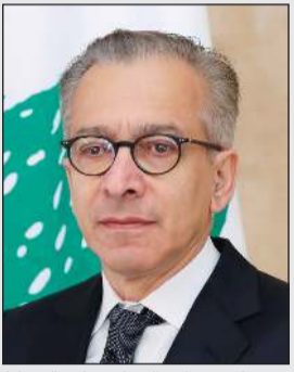
وزير الاقتصاد والتجارة عامر البساط

وذكر البساط «أن هناك مؤشرات تدل على أن التعافي بدأ وأن هناك حركة اقتصادية نشطة. وتوقعاتنا لسنة 2025 تقدر بنمو اقتصادي هو 5% مقارنة بالعام الماضي بسبب الحرب الإسرائيلية. لا أقول أننا دخلنا مرحلة الازدهار، إنما هذه النسبة هي الأعلى منذ 2011».