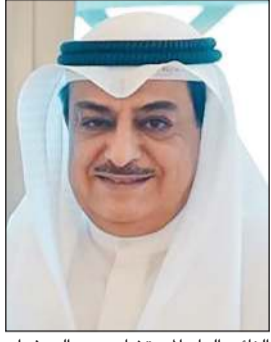
النائب العام المستشار سعد الصفران

تطوير منظومة العدالة الجزائية وضمان حماية الضحايا ورفع كفاءة التحقيق والملاحقة القضائية تنفيذاً للإستراتيجية الوطنية وتعزيزاً لالتزام الكويت بالمعايير الدولية