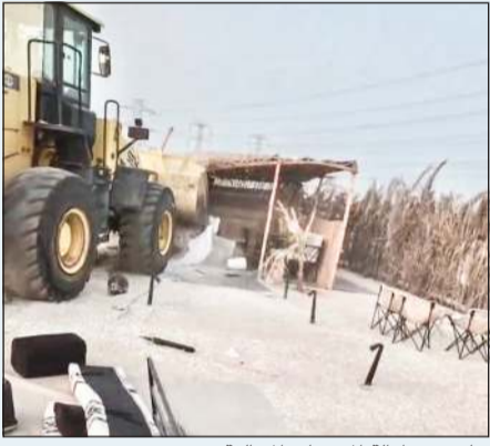
جانب من إزالة المخيمات المخالفة

بتوجيهات من وزير الدولة لشؤون البلدية ووزير الدولة لشؤون الإسكان عبداللطيف المشاري ومدير فرع بلدية محافظة الأحمدى سعد الخريش، نفذت لجنة المخيمات حملة ميدانية في منطقة بر الواحة في الأحمدى، أسفرت عن إزالة 5 مخيمات مخالفة و4 شاليهات ورفع سيارات مهيمة، إضافة إلى تحرير 3 مخالفات وتوجيه إنذارات و6 تعهدات. وتستمر الحملات بشكل يومي للحفاظ على المظهر العام وتطبيق اللوائح البلدية ومنع تكرار المخالفات في مناطق البر.