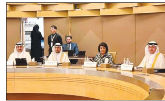
رئيس ديوان المحاسبة عصام الرومي خلال الاجتماع

وحول الدورة الـ 15 للجمعية العامة للمنظمة والمقرر عقدها غدا الثلاثاء، أوضح الوزان أن محاور