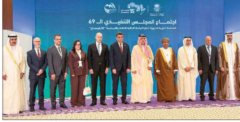
رئيس ديوان المحاسبة عصام الرومي مع المشاركين في اجتماع المجلس التنفيذي لـ «الأربوساي»

جدة - كونا: أكد مراقب إدارة الرقابة على الإنتاج والتصنيع للجهات النفطية في ديوان المحاسبة خليل الوزان أن مشاركة الديوان في اجتماعات المنظمة العربية للأجهزة العليا للرقابة المالية والمحاسبة (الأربوساي) تأتي في إطار دعم منظومة الرقابة المالية وتعزيز التعاون وتبادل الخبرات بين الأجهزة الرقابية العربية.