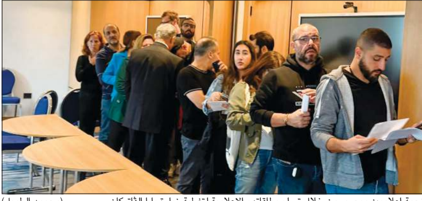
زحمة إعلاميين ومصورون خلال تسلم بطاقاتهم الإعلامية لتغطية زيارة بابا القاتيكان (محمود الطويل)

ساعات قليلة وتحط طائرة بابا القاتيكان ليو الرابع عشر رأس الكنيسة الكاثوليكية في العالم في مطار رفيق الحريري الدولي ببيروت، في زيارة رسمية إلى لبنان تستمر إلى 2 ديسمبر المقبل. وسيكون في استقبال البابا على أرض المطار رئيس الجمهورية العماد جوزف عون. ولا شك في أن مفعول الزيارة في السياسة سيكون حماية «دولة لبنان الكبير» بعد 125 سنة على قيامها، زيارة تكرس حفظ لبنان الوطن والكيان النموذج في هذه البقعة من الشرق الأوسط. وتنتأى بـ «وطن الأرز» عن محاور إقليمية «اقتيد» إليها دون إرادة رسمية، و«تورط» في حروب تركت نداعات، آخرها ما يتعلق بالحرب الإسرائيلية الموسعة الأخيرة بين 20 سبتمبر و27 نوفمبر 2024، والتي لم تضع أوزارها بعد، لعدم التزام إسرائيل باتفاق وقف إطلاق النار الموقع برعاية أميركية - فرنسية، ويجه لبنان الرسمي بقيادة رئيس الجمهورية لتأمين مظلة دولية له يشترك فيها القاتيكان، سعياً إلى تطبيق وقف إطلاق النار. لتمكن الدولة اللبنانية من مواصلة خطتها بنزع السلاح غير الشرعي، وبسط سلطتها منفردة على كامل الأراضي اللبنانية دون شريك. وإذا كان البعد السياسي يتصدر مشهد الزيارة، فإن