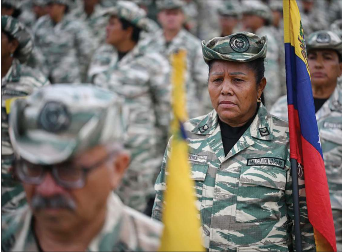
عناصر من الميليشيا البوليفارية الوطنية خلال استعراض عسكري في كراكاس الأسبوع الماضي

عواصم - وكالات: أعلن الرئيس الأميركي دونالد ترامب إغلاق المجال الجوي لقرنويلا. ووسط تفاقم الأزمة بين البلدين على خلفية تجارة المخدرات، قال الرئيس الأميركي في منشور مقتضب على منصفته «تروث سوشيل»: إلى كل شركات الطيران، الطيارين، مهربي المخدرات، والمتاجرين بالبشر، يرجى اعتبار أن المجال الجوي لقرنويلا وما حولها مغلق بالكامل. وتزامناً مع تصريحات ترامب، أظهرت خرائط مواقع «فلايت رادار» خلو المجال الجوي لقرنويلا من الطائرات. من جهتها، اعتبرت وزارة الخارجية الكوبية أن «التدخل الأميركي في المجال الجوي جزء من تصعيد العدوان ضد فنزويلا للإطاحة بالحكومة الشرعية». وأدانت «عمليات التشويش الكهرومغناطيسي في البحر الكاريبي خاصة على المجال الجوي لقرنويلا» وقالت: «هناك تشويش في منطقة الكاريبي ناجم عن الانتشار العسكري الهجومي والاستثنائي للولايات المتحدة». يأتي ذلك في وقت كشفت الإدارة الأميركية الضغط على فنزويلا من خلال