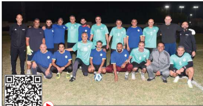
لاعبو قدامى «الأزرق» و«التطبيقي» قبل انطلاق المباراة