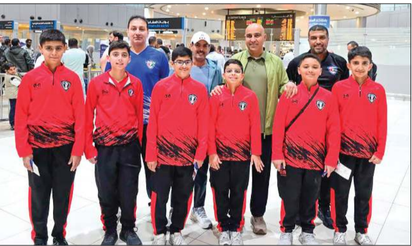
وفد منتخبنا الوطني للناشئين للإسكواش توجه إلى ماليزيا

غادر أمس منتخبنا الوطني للناشئين للإسكواش أرض الوطن متوجها إلى العاصمة الماليزية (كوالالمبور)، وذلك للمشاركة في بطولة كوالالمبور السابعة عشرة المفتوحة للناشئين، والتي ستقام خلال الفترة من 2 إلى 7 ديسمبر المقبل.