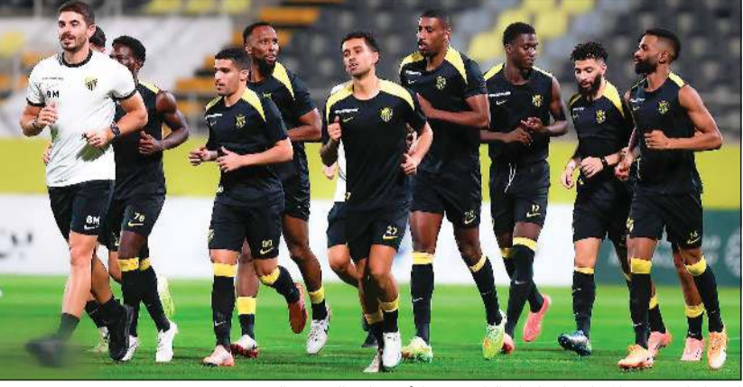
الاتحاد لتصحيح المسار واستكمال الطريق في كأس خادم الحرمين الشريفين

لم يكد الاتحاد يستعيد توازنه بعد النافذة الدولية الأخيرة بفوز محلي، حتى سقط قاريا، ما أجبر مدربه البرتغالي سيرجيو كونسيساو على الاعتراف بأن «الوضع ليس على ما يرام»، قبل مواجهة الشباب غدا السبت في ربع نهائي كأس خادم الحرمين الشريفين لكرة القدم.