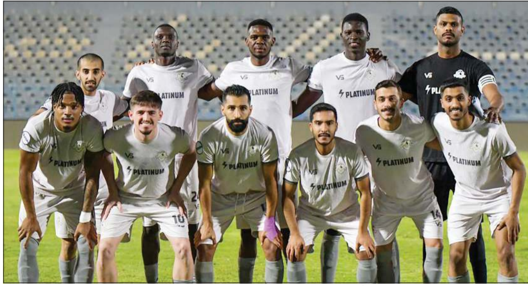
الجزيرة عبر الشامية إلى دور الـ 16 لبطولة كأس سمو ولي العهد