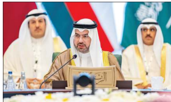
رئيس الهيئة العامة للطيران المدني الشيخ حمود المبارك خلال الاجتماع

وأضاف أن توظيف الذكاء الاصطناعي والتقنيات الرقمية أصبح عاملاً محورياً في تطوير منظومة النقل الجوي من خلال تحسين كفاءة الإجراءات وتسهيل وتنسيق السفر وتعزيز مستوى السلامة والجودة في جميع مراحل السفر، لافتاً إلى أن ذلك يتطلب تنسيق التشريعات لربانسة الجمعية العمومية لمنظمة الطيران المدني في البحرين، التي عكست الأهمية بقطاع الطيران ومدى الإمكانات الفنية والإدارية والمالية التي تتوافر في دول مجلس التعاون.