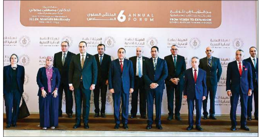
د.مصطفى مدبولي رئيس مجلس الوزراء في الجلسة الافتتاحية للملتقى الدولي السادس للهيئة العامة للرعاية الصحية

أكد د.مصطفى مدبولي رئيس مجلس الوزراء أن مشروع التأمين الصحي الشامل يعد أحد أهم المشروعات المصرية خلال السنوات القليلة الماضية، إيماناً بحق كل مواطن في الحصول على خدمات صحية متكاملة، بأعلى معايير الجودة، وعلى نحو عادل، يحقق رضا المواطن، ويضمن استدامة التمويل، والالتزام بتحقيق التغطية الصحية الشاملة، باعتبارها أحد أهداف الأمم المتحدة للتنمية المستدامة، ومن ركائز رؤية مصر 2030.