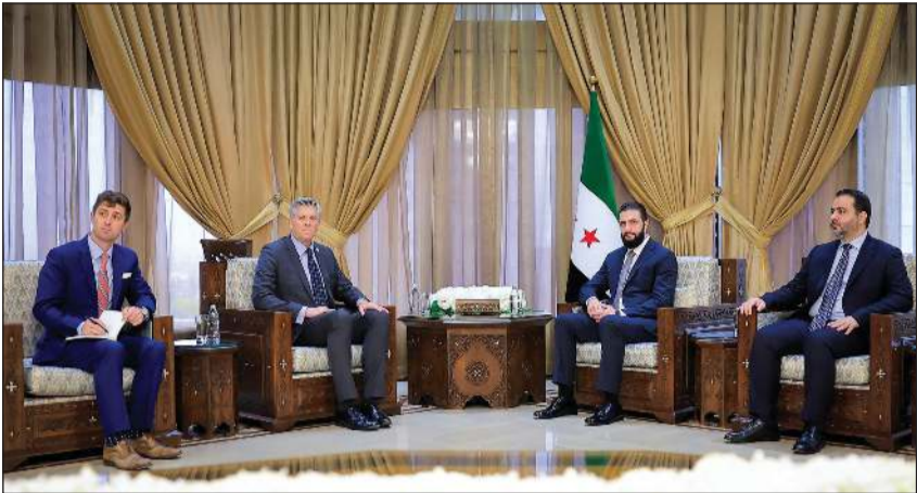
الرئيس السوري أحمد الشرع مستقبلاً في دمشق أمس وفداً من الكونغرس برئاسة عضو مجلس النواب دارين لحوذ

وكالات: استقبل الرئيس السوري أحمد الشرع في دمشق أمس وفداً من الكونغرس الأميركي برئاسة عضو مجلس النواب دارين لحوذ، وذلك ليحت سبل تعزيز التعاون بين البلدين. وقالت وكالة الأنباء السورية «سانا»، إن اللقاء حضره وزير الخارجية أسعد الشبيبي، حيث جرى تبادل وجهات النظر حول عدد من القضايا الدولية ذات الاهتمام المشترك، والتأكيد على أهمية مواصلة التواصل البناء بين الجانبين، بما يخدم المصالح المشتركة ويسهم في دعم الاستقرار الإقليمي.