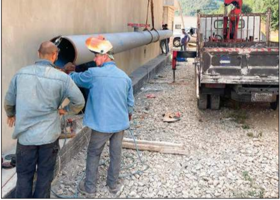
تركيب أنابيب المياه من الآبار الارتوازية إلى محطة الضخ