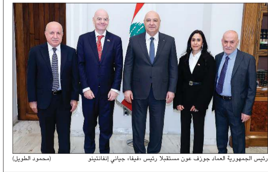
رئيس الجمهورية العماد جوزف عون مستقبلاً رئيس «فيفا» جياني إنفانتينو

بيروت: استقبل رئيس الجمهورية العماد جوزف عون رئيس الاتحاد الدولي لكرة القدم «فيفا» جياني إنفانتينو ترافقه زوجته اللبنانية لينا الأشقر ورئيس الاتحاد اللبناني لكرة القدم م.هاشم حيدر والأمن العام جهاد الشحف.