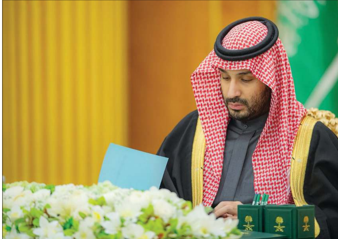
صاحب السمو الملكي الأمير محمد بن سلمان ولي العهد رئيس مجلس الوزراء السعودي مترشحا لجلسة مجلس الوزراء

في الاقتصاد المحلي في المملكة وستسهم في بناء اقتصاد متنوع ومستدام وإيجاد فرص للشركات