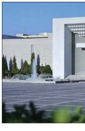
مبنى القصر الرئاسي

وكان ستوتزمان زار ضمن وفد من الكونغرس الأميركي سورية في شهر أبريل الماضي، وأكد في أعقاب الزيارة أن هناك الكثير من الحكاميات للتعاون مع الحكومة السورية، معرباً عن تمنياته للشعب السوري بالحصول على المزيد من الفرص الاقتصادية، والازدهار كما هو الحال في الدول المتقدمة.