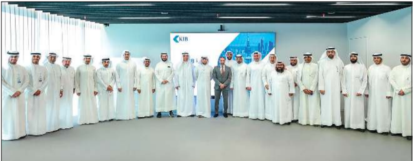
صورة جماعية للمشاركين في الفعالية

مبتكراً يرفع مستوى جودة خدمات التقييم في السوق المحلي. وتتمثل أبرز أهداف المبادرة في تسهيل وصول المستفيدين إلى مقدمي خدمات التقييم العقاري، وتمكين وتحفيز مكاتب التقييم المعتمدة، إلى جانب توفير حلول رقمية تساهم في رفع جودة التقارير العقارية وكفاءتها. كما تتضمن المبادرة مجموعة من المزايا المقترحة، أبرزها التعامل الحصري مع منصات مرخصة من وزارة التجارة والصناعة، وتسليم عروض متعددة من المقيمين، وخدمات دفع إلكترونية عبر بوابة «كي نت».