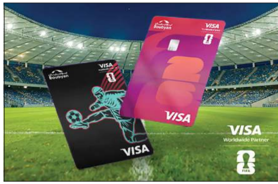
بطاقات بنك بوبيان Visa كأس العالم FIFA 2026™ «مسبقة الدفع

من جانبها، أعربت شركة Visa عن اعتزازها بمواصلة التعاون مع بنك بوبيان لإطلاق هذه النسخة الخاصة من بطاقة «VISA كأس العالم FIFA 2026™». مؤكدة أن هذا التعاون يعكس الرؤية المشتركة للطرفين في تطوير منظومة المدفوعات الرقمية في الكويت، وتمكين العملاء والمستخدمين من الاستفادة بحلول دفع آمنة ومتقدمة تعكس روح الحدث الرياضي الأكبر في العالم. وأضافت «أن إطلاق البطاقة يمثل خطوة جديدة نحو تعزيز الابتكار وتوفير تجارب دفع