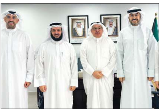
جانب من زيارة وفد «النجاة» إلى «هيئة الشباب»

أوقاتهم فيما يعود عليهم وعلى المجتمع بالنفع. وأضاف أن اللقاء تناول بحث أوجه التعاون بين الجانبين، خاصة في مجالات المسابقات التربوية والثقافية، والبرامج التعليمية، والمبادرات التطوعية، مؤكداً أن النجاة الخيرية تمتلك خبرة طويلة في تنفيذ المشاريع التي تخدم الشباب وتنمي مهاراتهم وتصل قدراتهم، وأكد الوندة أن الكويت تزخر برصيد كبير من الطاقات البشرية الشابة القادرة على التميز والمبادرة