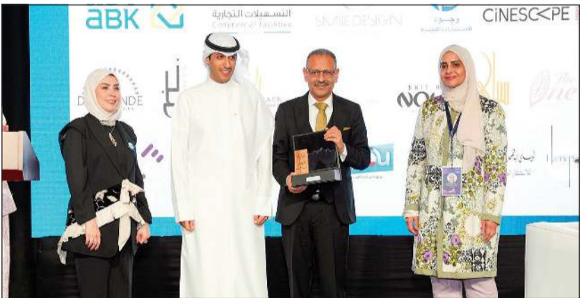
تكريم شركة التسهيلات التجارية على هامش المؤتمر

رعاية شركة التسهيلات التجارية، مؤكداً أن دعم القطاع الخاص يعزز منظومة الحماية الوطنية، ويؤكد أهمية الشراكة المجتمعية في بناء جيل قادر على المشاركة في صناعة مستقبل البلاد. تعبر شركة التسهيلات التجارية هي الأولى من نوعها في تمويل السلع الاستهلاكية على مستوى دول مجلس التعاون الخليجي، حيث أسست عام 1977 لتتبع منذ ذلك الحين مكانة رائدة في قطاع التمويل امتدت لأكثر من 48 عاماً.