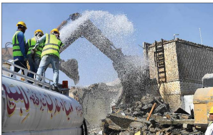
جرافات البلدية خلال إزالة أحد المباني المتهاككة مع استخدام المياه لعدم تثار الغبار على المنازل المحيطة

الحكومية تأمين المباني للتأكد من الهدم بطريقة صحيحة، مؤكداً أن التعاون بين الجهات المختصة في عملية الهدم منذ بدايتها ممتاز. وأشار في الحملة كل من قطاع شؤون الأمن الجنائي، وقطاع شؤون مديريات الأمن، وبلدية الكويت، وقوة الإطفاء العام، ووزارة الكهرباء والماء والطاقة المتجددة، والطوارئ الطبية، حيث قامت الجهات المشاركة بتأمين الموقع، وقطع الأعمال منافية للأداب وتشكل ماوى للخارجين عن القانون. وبعد المعاينة الفنية التي نفذت بالتنسيق مع وزارة الأشغال العامة، تبين أن العقار الذي تمت إزالته يشكل خطراً مباشراً على الأرواح والممتلكات، فيما يجري استكمال الإجراءات القانونية والفنية بشأن العقارات الأخرى المخالفة تمهيداً لإزالتها. وجددت وزارة الداخلية تأكيدها على مواصلة العمل الميداني المشترك مع الجهات المختصة للتعامل مع العقارات والمواقع المخالفة التي تشكل خطورة على الأرواح والممتلكات، واتخاذ الإجراءات القانونية حيال مستغلبها، بما يضمن تعزيز السلامة العامة وتحسين البيئة السكنية في المنطقة.