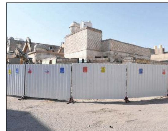
جانب من عملية تسوير العقارات الآيلة للسقوط في الجليب