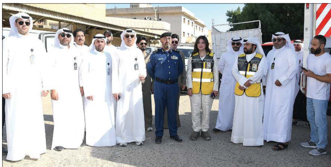
مدير عام البلدية بالتكليف م. منال العصفور ورئيس قوة الإطفاء العام اللواء طلال الرومي ورئيس فريق الضبطية القضائية في وزارة الكهرباء والماء والطاقة المتجددة م. عبدالله العيباني مع ممثلي الجهات المشاركة في عملية الإزالة