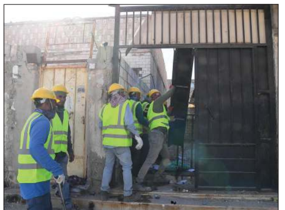
عمل البلدية خلال المشاركة في عمليات الهدم