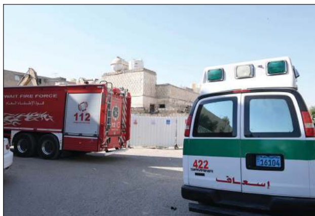
سيارات الإطفاء والإسعاف في موقع الهدم