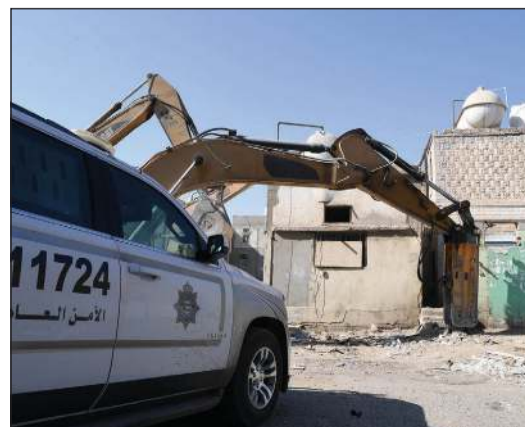
تواجد أمني رافق الحملة