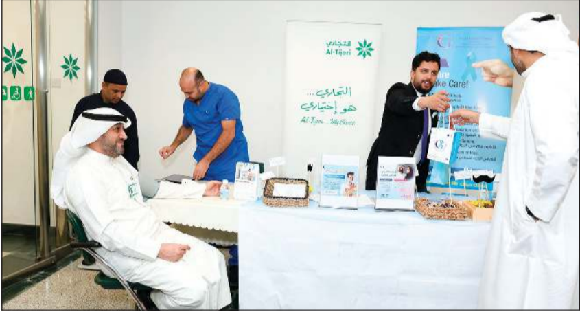
جانبا من مشاركة موظفي البنك التجاري في الفعالية

بمناسبة شهر التوعية بصحة الرجل، والذي يصادف شهر نوفمبر من كل عام، وفي إطار جهوده التوعوية المستمرة للحفاظ على الصحة العامة وتعزيز الوعي بمرض سرطان البروستاتا وطرق الوقاية منه، نظم البنك التجاري الكويتي مجموعة من الأنشطة الصحية لموظفيه خلال شهر نوفمبر 2025.