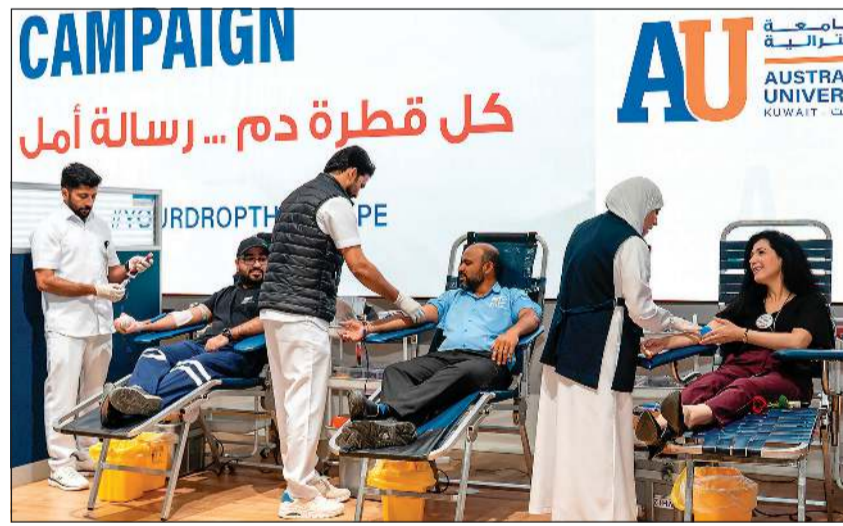
جانبا من حملة التبرع بالدم

زراعة حبا وعتاء، شكرا من القلب، فكل قطرة دم تكتب رسالة أمل جديدة في حياة إنسان».