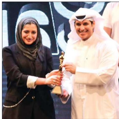
شهد البلوشية - أفضل أزياء مسرحية

● شركة كويت فيلم للممثل صالح البحير عن «منبه» لفرقة المسرح الكويتي. ● نورة بك سنيح للفنان عبدالرزاق بهبهاني عن «قمر» لفرقة تريند. ● الاتحاد الكويتي للمنتجين باسم الفنانة حياة الفهد للفنان عبدالله البلوشي عن دوره في «قمر» لفرقة تريند. ● شركة ماجيك لينس للمخرج فاضل النصار عن «منبه» لفرقة المسرح الكويتي. أما الجوائز الرسمية التي منحتها الهيئة العامة للشباب في ختام الدورة الـ16 ف جاءت كالتالي: ● أفضل عرض مسرحي متكامل مسرحية «صيد ثعالة» لفرقة المعهد العالي للفنون المسرحية. ● أفضل مخرج وذهبت إلى يحيى الخراسي عن «صيد ثعالة» لفرقة المعهد العالي للفنون المسرحية.