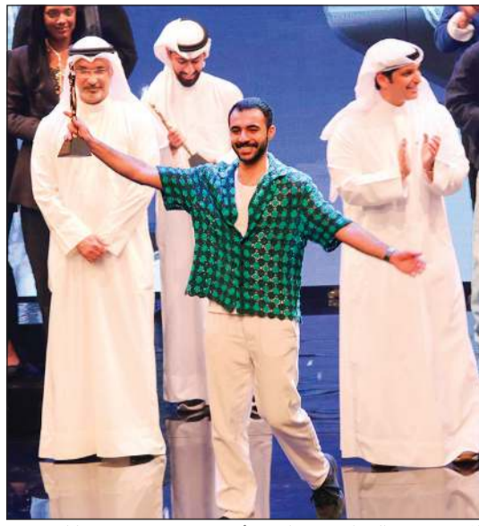
المخرج يحيى الخراسي - جائزة «أفضل عرض مسرحي متكامل»