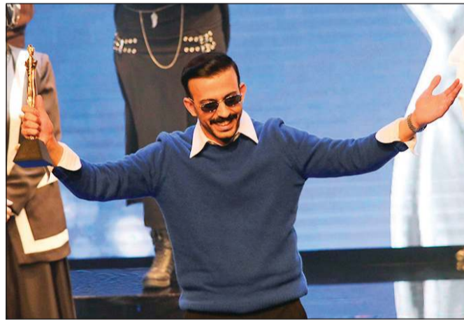
المخرج هاني الهزاع - جائزة «التميز» التي تمنحها الهيئة العامة للشباب